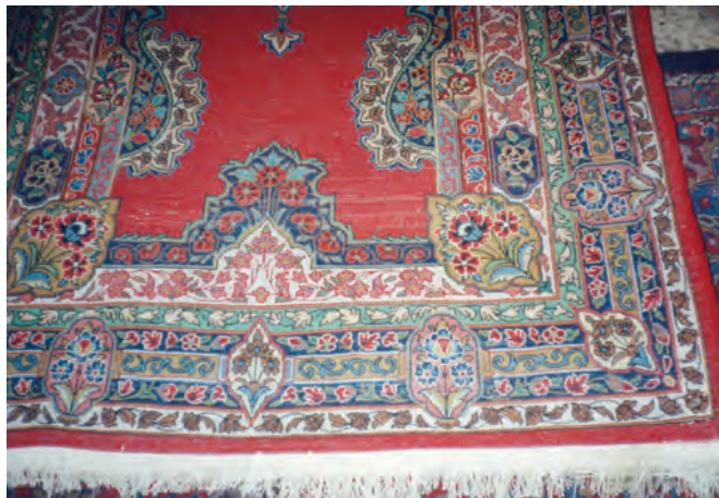
تصویر (۵): سفیدک زدن پشت قالی