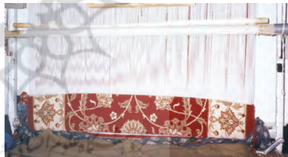
تصویر (۴): پایین زدگی دو طرف قالی

علل ایجاد عیب پایین زدگی قالی محلات، در ۴۷/۶٪ موارد عدم تناسب مواد اولیه با رج شمار قالی است. نامناسب بودن ضخامت مواد اولیه، نخ بود و پرز و چله، یعنی نازک بودن هر یک از آنها و یا مجموعه آنها باعث بروز عیب پایین زدگی می شود. سفت بودن بیش از حد چله یا عدم نظم آن عامل بروز این عیب در ۱۴/۳٪ و نایکنواختی ضربات شانه ۱۴/۳٪ از موارد مشاهده شده را شامل می شود.