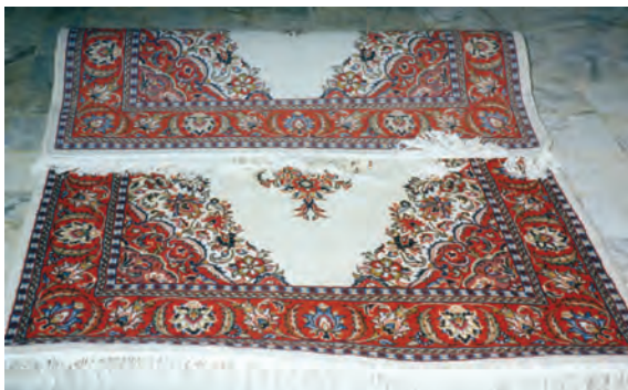
تصویر (۳): کجی در گلیم بافی ابتدای قالی

به دنبال علت یابی عیوب و با در نظر گرفتن عوامل موثر بر ایجاد کجی در قالی در ۵۱ مورد یعنی ۴۲/۱٪ از موارد مشاهده شده مهم ترین علت ایجاد کجی در قالی، کشیدن بیش از حد پود ضخیم است. در ۸/۳٪ از موارد توزیع نامناسب تارها در عرض قالی، در ۲/۵٪ معیوب بودن دار قالی و در سایر موارد عدم استفاده از پهنان یا سایر ابزار مشابه آن و تاب زیاد پود ضخیم باعث ایجاد این عیب شده است.