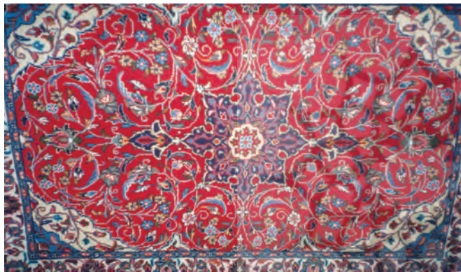
تصویر (۶): ترنج دار شدن قالی

مهم ترین علل ایجاد بالازدگی قالی محلات عبارت است از عدم تناسب مواد اولیه یعنی ضخامت زیاد هر یک از مواد اولیه، نخ پود، چله یا پرز یا توامان با رج شمار قالی که در ۴۶/۵٪ از موارد مشاهده شده است، (جدول شماره ۵). از دیگر عوامل بروز این عیب می توان شل بودن تارهای قالی در ۱۳/۹٪ از موارد و نایکنواختی ضربات شانه در ۱۱/۶٪ از موارد را نام برد. عدم نظم در فاصله تارها نیز ۷٪ موارد را شامل می شود.