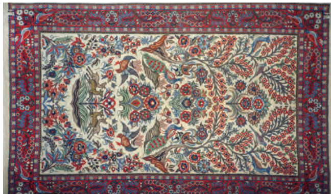
تصویر (۱): قالی محلات