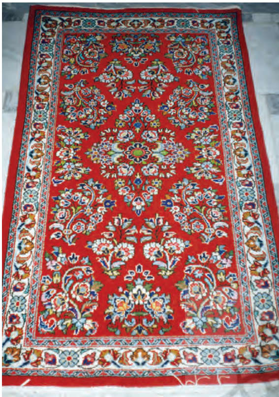
تصویر (۲): قالی محلات