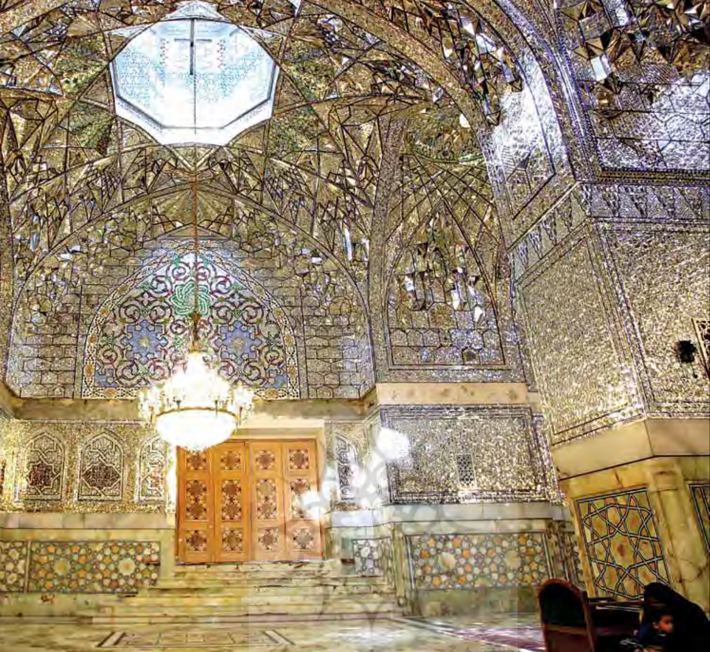
دارالسرور، آستان قدس رضوی

به این نکته اشاره می‌کند: «در چهل ستون اصفهان بر دیوار سر حوض، آینه‌ای بزرگ و شفاف نصب کرده بودند که «آینهٔ چهل ستون‌نما» یا «جهان‌نما» نامیده می‌شد و بزرگی و روشنی آن بدان حد بود که تصویر مردمی که از «در عرابه» چهل ستون (با فاصلهٔ حدود ۱۸۰ متر از بنا) وارد می‌شدند، در آینه دیده می‌شد.» سپس، قطعه‌های آینه به تدریج کوچک‌تر شدند تا آنکه در پایان سدهٔ ۱۳ق/۱۹م قطعه‌های کوچک آینه به شکل مثلث، لوزی، شش گوش و مشابه آن درآمدند و هنرمندان آن‌ها را به صورت الماس تراش به کار بردند. گذشته از این‌ها، آینه‌کاران ایرانی از شیشه‌های محدب، که آن‌ها را به صورت آینه درمی‌آوردند، نیز استفاده می‌کردند.