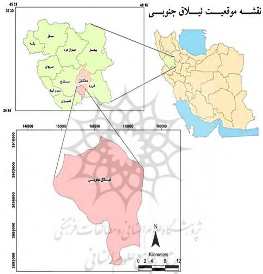
شکل ۲ موقعیت بخش نیلاق جنوبی

روایی صوری و پایایی مطلوب در قالب گزینه‌های طیفی پس از کمی‌سازی مورد سنجش و آزمون قرار گرفتند.