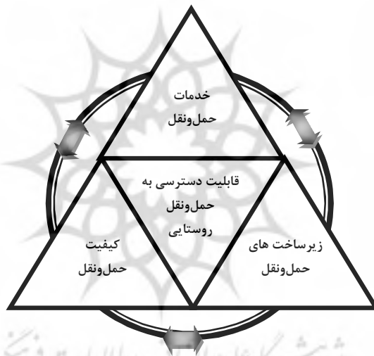
شکل ۱ عناصر تشکیل‌دهنده حمل و نقل روستایی

رویکرد یکپارچه در مورد سرمایه‌گذاری در حمل و نقل روستایی، مستلزم شناخت کلی نیازهای دسترسی و قابلیت تحرک جوامع روستایی و همچنین شناخت راه‌های روستایی و سرمایه‌گذاری در زیربخش‌های آن است. تأکید این نگرش بر مردم‌محوری، جهت‌دهی به تقاضاها و نیازهایی است که بر زندگی جوامع روستایی تأثیر می‌گذارند. در این چارچوب، حمل و نقل روستایی به‌طور وسیع نهاد موفق‌تری در استراتژی‌های معیشت روستاییان است و عناصر تشکیل‌دهنده آن - همان‌طور که شکل شماره یک نشان می‌دهد - شامل سه عنصر مکمل وسایل حمل و نقل، کیفیت امکانات و تسهیلات و زیرساخت‌های حمل و نقل است که با معیارهای زمان، تلاش و هزینه اندازه‌گیری می‌شود (Starkey et al., 2002: 9).