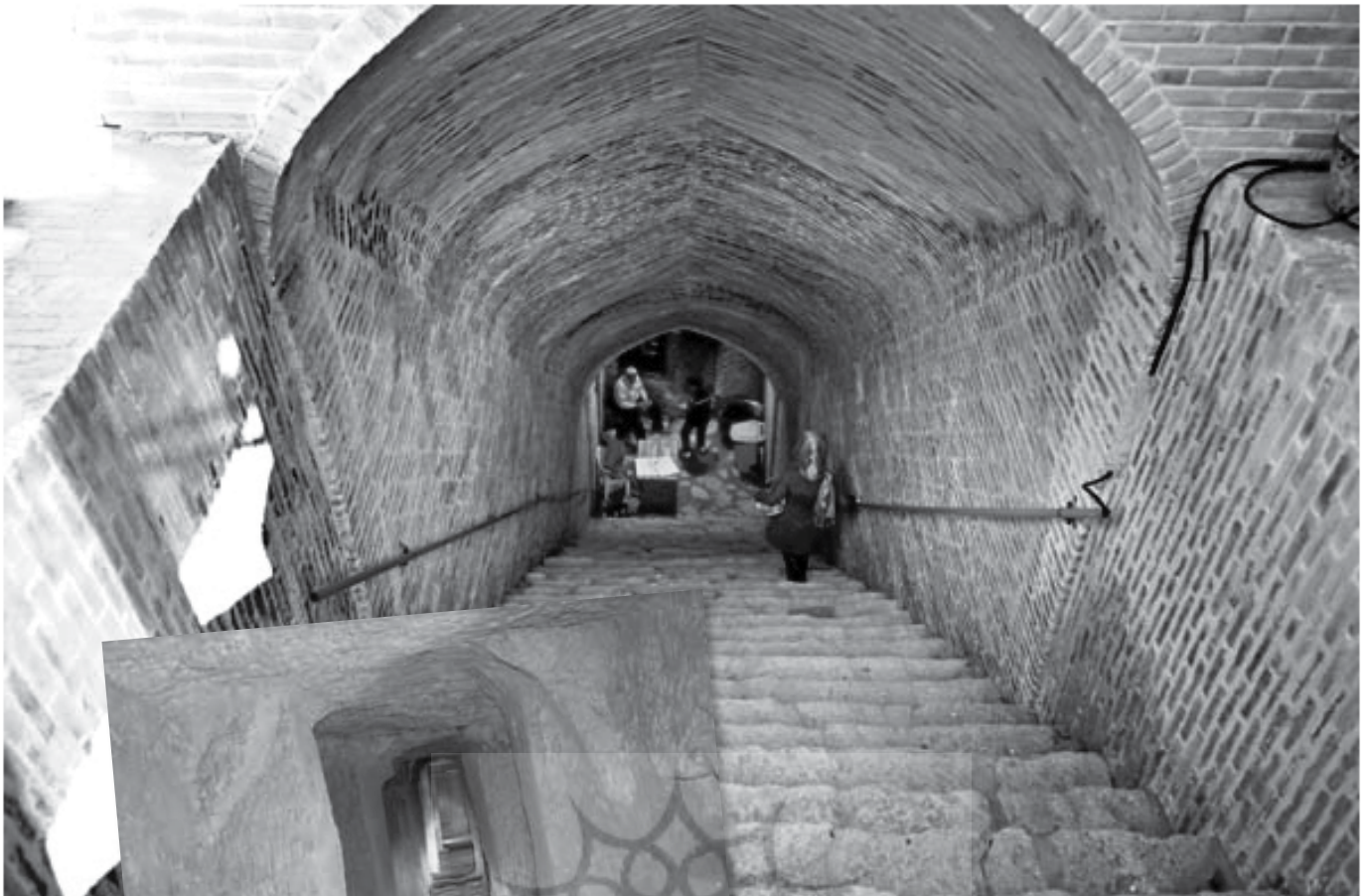
ورودی شهر زیرزمینی

اطراف شهر مرتبطاند. بنا به قول باستان‌شناسان هسته اصلی این معماری بی‌نظیر در دروه ساسانی شکل گرفته است (مشهدی، ۱۳۸۶). برخی از آن به عنوان پدافند غیرعامل یاد کرده‌اند، زیرا در تعریف آن گفته می‌شود: «مجموعه اقداماتی که بدون به کارگیری سلاح جنگی انجام می‌شود تا از وارد شدن خسارت‌ها به تجهیزات و تأسیسات حیاتی و حساس نظامی و غیرنظامی و البته تلفات انسانی جلوگیری کند یا میزان این خسارت‌ها و تلفات را به حداقل برساند.» مردم ایران به دلیل وضعیت جغرافیایی خاص کشور و قرارگیری شان در مسیر روندگان به غرب و شرق هر از چند گاهی مورد تجاوز و تاخت و تاز اقوام مختلف قرار می‌گرفتند و چاره‌ای نداشتند جز آنکه علاوه بر ساختن دیوار و قلعه و ارگ و حصار، دست به دامان شهرهای زیرزمینی یا همان پدافند غیرعامل شوند. این شهر زیبا نه تنها ارزش تاریخی، بلکه ارزش فرهنگی، مردم‌شناسی، روان‌شناسی، معماری، سیاسی و بسیاری از شاخه‌های دیگر علوم را دارد که در جای خود باید به آن‌ها پرداخت.