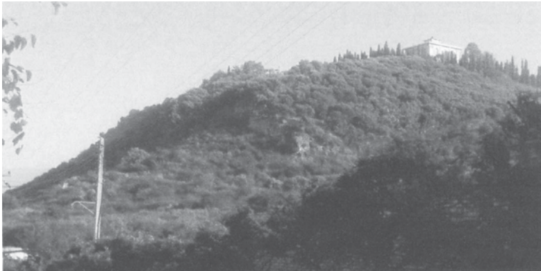
تصویر ۲. دریاوار صفی آباد

پادگانه در ارتفاع ۵۰ - ۴۵ متر از سطح دریای آزاد قرار گرفته است. اهلرز ۵ (۱۳۶۵: ۱۵۴) پادگانه‌هایی را که در چنین ارتفاعی قرار گرفته‌اند متعلق به «وورم» پیشین می‌داند.