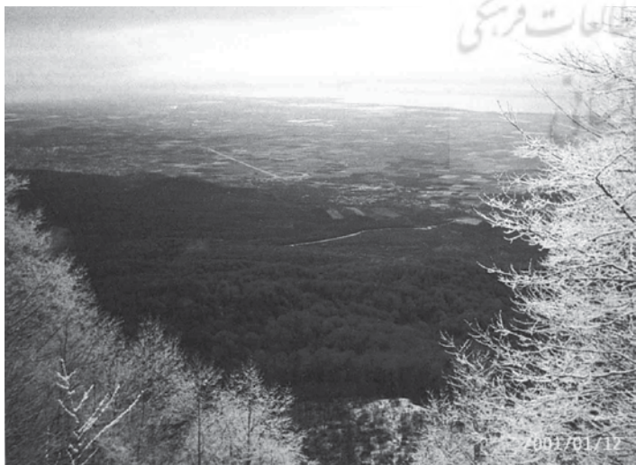
تصویر ۶. سه فصل در یک تصویر، به ترتیب از جلو: زمستان، پاییز و بهار (گلدهی کلزا در جلگه)

در اراضی شیب‌دار، جنگل‌ها تخریب شده‌اند و زمین‌های کشاورزی به وجود آمدند. این زمین‌ها عموماً به زیر کشت گیاهان یک‌ساله می‌روند. شخم‌زدن نامناسب زمین (شخم در جهت شیب) موجب فرسایش شدید خاک شده است؛ به طوری که پس از هر بارندگی شدید، شیارهای عمیقی در آن ایجاد می‌شود. تداوم فرسایش