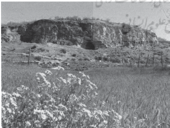
تصویر ۳. غار هوتو

در فاصله یک کیلومتری غرب بهشهر (بین شهر بهشهر و روستای شهیدآباد)، دو غار «هوتو» ۶ و «کمر بند» و در شرق آن، غار «علی تپه» قرار دارد. این غارها نمونه‌هایی از اشکال «کارستی» ۸ در سنگ‌های آهکی دوران مزوزویک هستند که بر اثر نفوذ آب از محل درز و شکاف سنگ‌ها، انحلال آهک و توسعه درزها و شکاف‌ها ایجاد شده‌اند. متأسفانه در مورد غار علی تپه مطالعات باستان‌شناسی زیادی صورت نگرفته است، اما کاوش‌های انجام شده در سال ۱۹۴۹ (۱۳۲۸ ه.ش) در غار کمر بند، نشان‌دهنده شش طبقه از دوره میانه سنگی تا نوسنگی است. آثار به دست آمده از این غار مراحل تکامل معیشتی انسان را از شکار آهو و بز کوهی تا زراعت و اهلی کردن حیوانات در آغاز هزاره چهارم پیش از میلاد نشان می‌دهد. در کاوش‌های به عمل