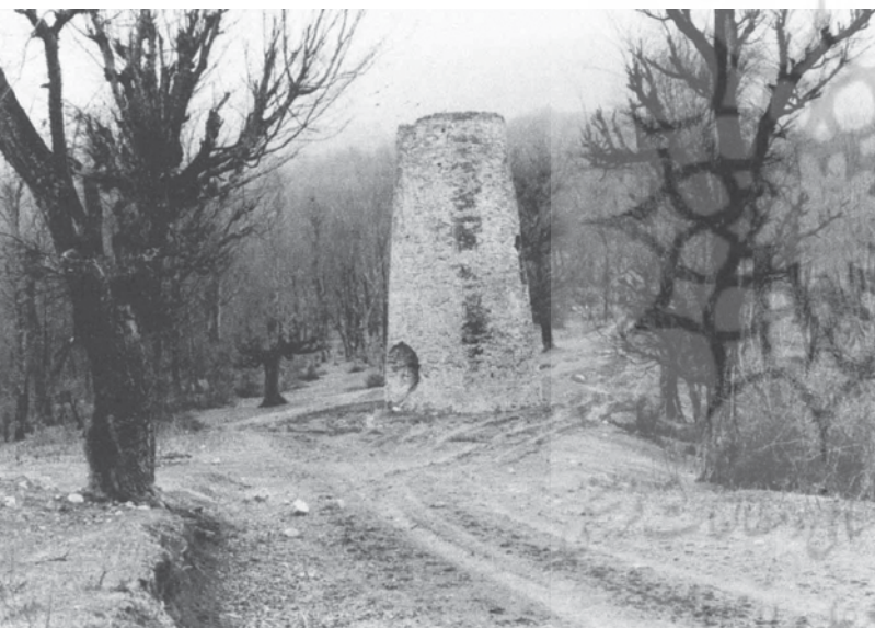
تصویر ۴. برج تاریخی عباس‌آباد

یکی از جاذبه‌های این مجموعه سیستم آبرسانی آن است که برای اطلاع بیشتر خوانندگان عزیز به گوشه‌هایی از آن اشاره می‌کنیم. آب مورد نیاز مجموعه تاریخی، از چشمه‌های قوری چشمه و سرچشمه به وسیله کانال‌های روباز و لوله سفالی مرتبط به هم (تنبوشه) به سمت گل باغ (جنوب شرقی مجموعه) و از آن جا به تمام بخش‌ها منتقل می‌شد. با توجه به اختلاف ارتفاع ۱۰ متری گل باغ با باغ اصلی (شمال مجموعه)، برای جلوگیری از پارگی و شکستگی ناگهانی لوله‌های سفالی و هم‌چنین، ضربات قوچی شکل