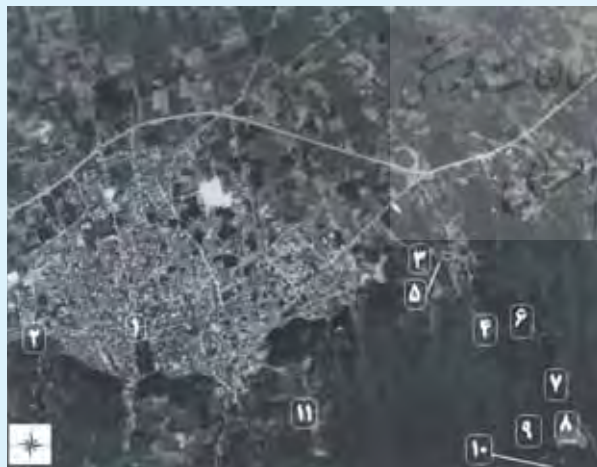
تصویر ۱. تصویر ماهواره‌ای محدوده مورد مطالعه

محدوده مورد مطالعه در حدفاصل بهشهر با مختصات جغرافیایی ۳۶ درجه و ۴۱ دقیقه عرض شمالی و ۵۳ درجه و ۳۲ دقیقه طول شرقی، و مجموعه تاریخی عباس آباد با مختصات ۳۶ درجه و ۳۰ دقیقه عرض شمالی و ۵۳ درجه و ۳۵ دقیقه طول شرقی، قرار گرفته است.