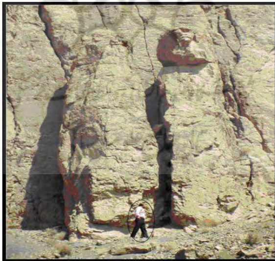
شکل (۴) فرایندهای دامنه‌ای واژگونی به صورت یک ژئومورفوسایت

جاذبه‌ها و قابلیت‌های گردشگری: جاذبه‌های آموزشی در زمینه‌ی درک نوعی از فرایندهای دامنه‌ای که به دلیل فاصله از مراکز مسکونی و عدم خطرات بالقوه برای آن، قابلیت تبدیل شدن به یک سایت آموزشی برای گردشگری‌های علمی، جاذبه‌های تفریحی به منظور تفرجگاه کوهنوردی را داراست.