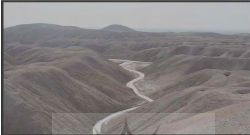
شکل (۶) رودخانه‌ی فصلی شور در دامنه‌های پشت به جاده