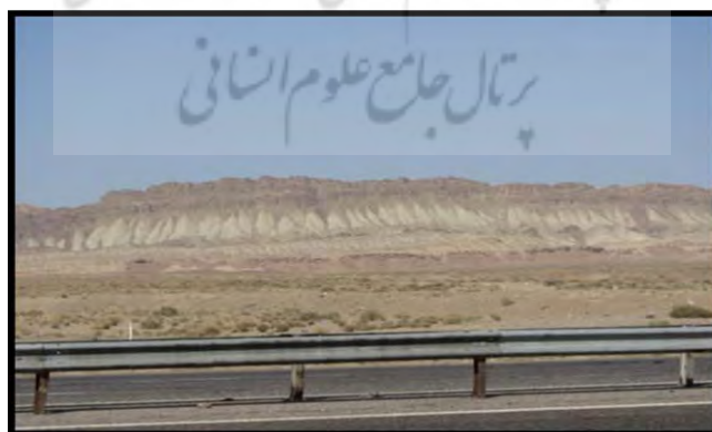
شکل (۳) بدلند و شیب های واریزه ای پیوسته در مجاورت آزاد راه قم - کاشان

جاذبه ها و قابلیت های گردشگری: جاذبه های آموزشی از منطقه علاوه بر مشاهده ی زیبایی چشم اندازها، در زمینه ی شناخت فرایندهای دامنه ای از نمونه توان های ژئومورفوتوریستی این سایت می باشد.