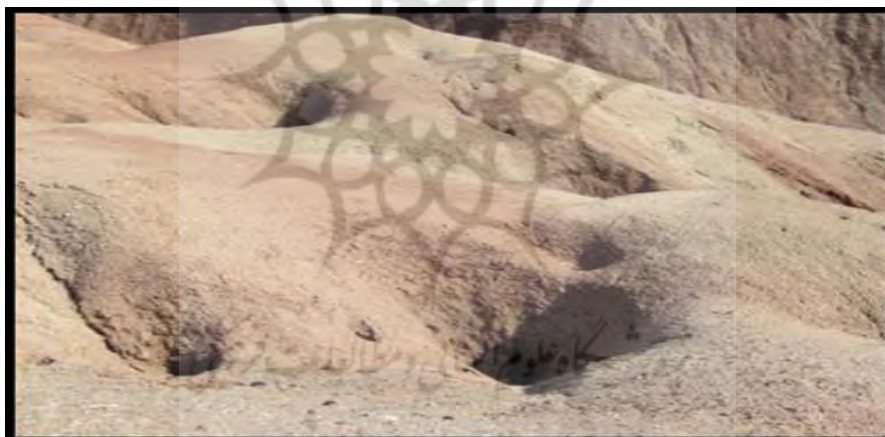
شکل (۷) پدیده پای پینگ در سطح گنبد‌های نمکی