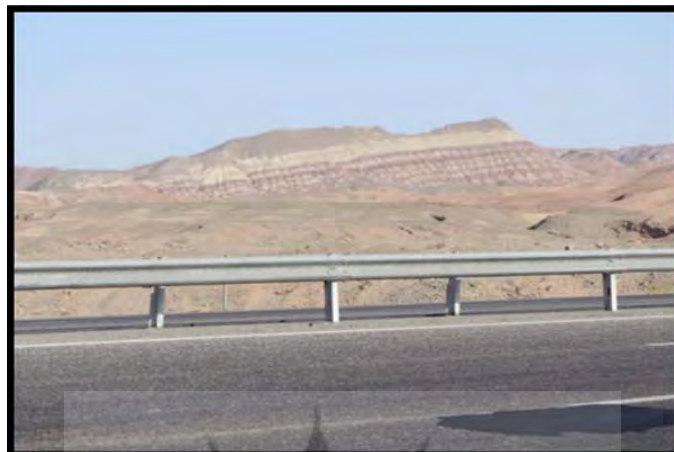
شکل (۲) اشکال چین خورده ترشیاری در تشکیلات تبخیری