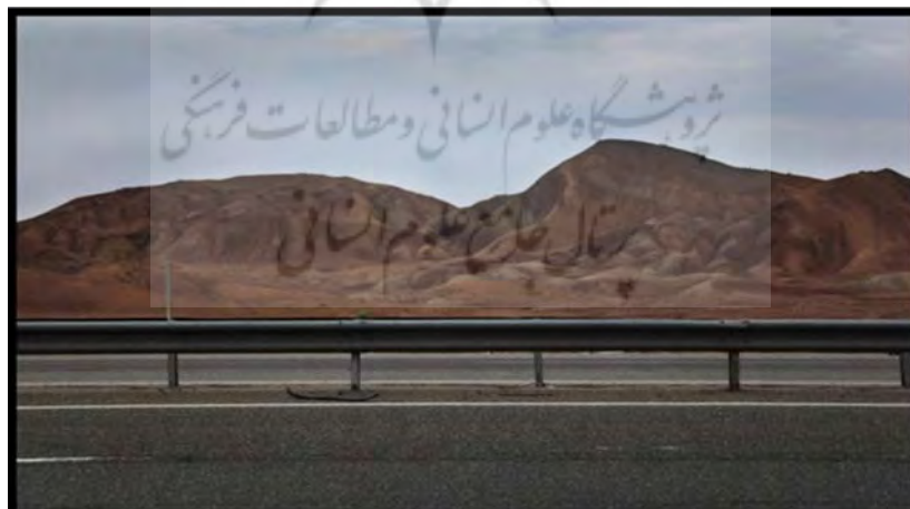
شکل (۵) گنبد نمکی نامنظم در مجاورت آزادراه قم- کاشان

جاذبه ها و قابلیت های گردشگری: آشنایی عموم گردشگران با پدیده های ژئومورفولوژیک و لندفرم های حاصل از تکتونیک نمکی نظیر پدیده پای پینگ و غیره؛ جاذبه های آموزشی (تخصصی) در زمینه شناخت تکتونیک، ماگماتیسم، ژئومورفولوژی ساختمانی و غیره.