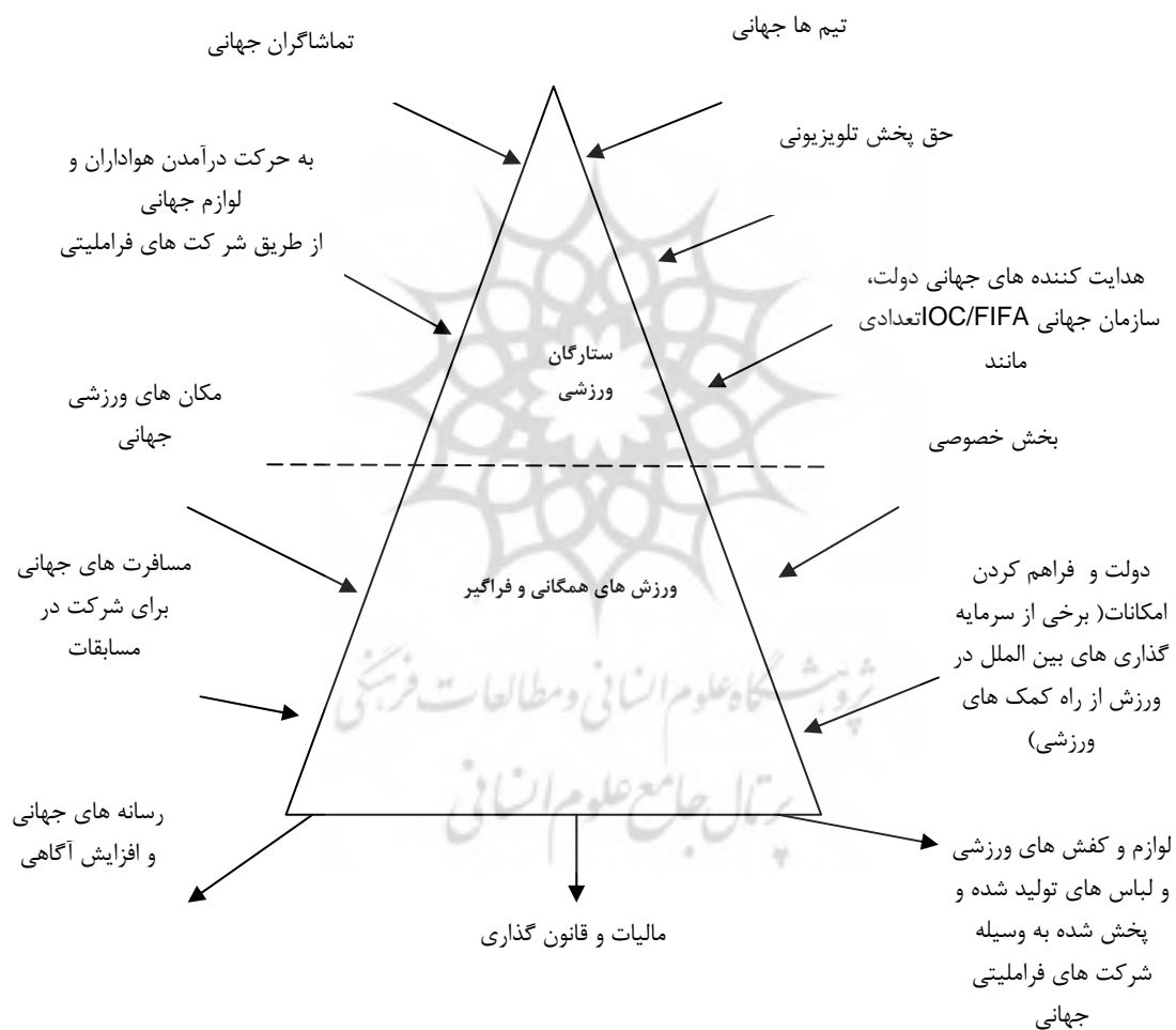
شکل (۱) مدل جهانی شدن ورزش (وارن، ویدریک، ۱۳۸۴:۷۲)

ساختارهای نظام جهانی ورزش و پویایی آن با طراحی، تنظیم و اقدامات حمایتی و مشارکتی دولت‌ها در کشورهای آمریکای شمالی، ژاپن، اروپای غربی و به طور کلی جهان توسعه یافته و قدرتمند تکوین یافت (Coakley: 2001: 337) و موجب توسعه فضای جغرافیایی و اجتماعی کشورهای مذکور شد و پس از آن در سایر کشورها مورد توجه قرار گرفت.