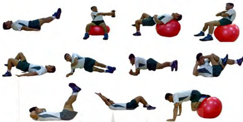
تصویر ۲- تمرین‌های پایداری ناحیه مرکزی بدن