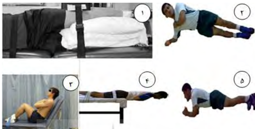
تصویر ۱- آزمون های میدانی پایداری ناحیه مرکزی بدن

سنجش قدرت ایزومتریک ابداکشن (دور کردن) ران روی آزمودنی که بر روی یک تخت درمانی به صورت درازکش به پهلو قرار دارد صورت می‌گرفت. یک بالشتک بین پاهای آزمودنی قرار می‌گرفت. رانی که مورد تست قرار می‌گرفت، باید با استفاده از پتو یا حوله در وضعیت دور شده (تقریباً ۱۰ درجه) قرار می‌گرفت. یک استرپ جهت تثبیت تنه آزمودنی درست در قسمت پروگزیمال ستیغ خاصه، دور تا دور فرد و تخت به طور محکم قرار می‌گرفت. مرکز بالشتک نیرو دینامومتر دستی نیکلاس به طور مستقیم در ۵ سانتی‌متری قسمت پروگزیمال واقع در بالای خط خارجی مفصل زانو واقع می‌شد. دینامومتر بین پا و استرپ دوم که اطراف پا و قسمت پایینی میز پوشیده می‌شد، به طور ایمن قرار می‌گرفت. استرپ اثر قدرت آزمونگر بر روی این اندازه‌گیری را که محدودیت دینامومتر دستی گزارش شده بود را حذف کرد. بعد از تنظیم کردن دینامومتر بر روی واحد کیلوگرم و تنظیم مدت زمان تست، دینامومتر در حالت شروع به کار قرار می‌گرفت. بعد از صفر کردن دینامومتر به آزمودنی آموزش داده شد تا پا را به سمت بالا با حداکثر کوشش برای ۵ ثانیه فشار دهد. مقدار نیروی نشان داده شده بر روی دینامومتر ثبت شده و دستگاه دوباره صفر می‌شد. یک مرحله جهت تمرین و سه مرحله جهت تست قدرت دور کردن ران با ۱۵ ثانیه استراحت بین هر مرحله انجام می‌شد. حداکثر مقدار نیرو از سه مرحله تست به عنوان قدرت ایزومتریک دور کردن ران ثبت می‌شد. (۲۹) (بخش ۱ در تصویر شماره ۱).