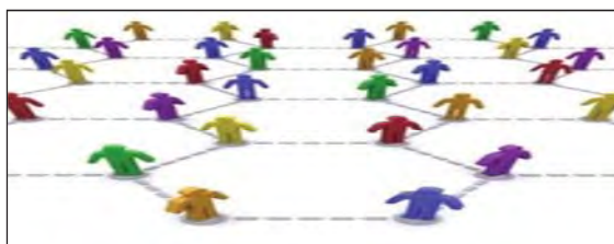
این طرح، شکل شبکه اجتماعی را نشان می‌دهد ( communicationage.blogfa.com/post-28.asp )

شبکه‌های اجتماعی، جماعت‌های مجازی در فضای سایبر هستند؛ این شبکه‌ها از طریق گروه‌های ایمیلی، وبلاگ‌ها، چت‌روم‌ها و سایت‌های دوست‌یابی نظیر اورکات و قزاق و شبکه‌های اجتماعی بر پایه اینترنت از قبیل «facebook.com» و «myspace.com» محیطی را برای تعامل و تبادل آرا به وجود می‌آورند. ۱