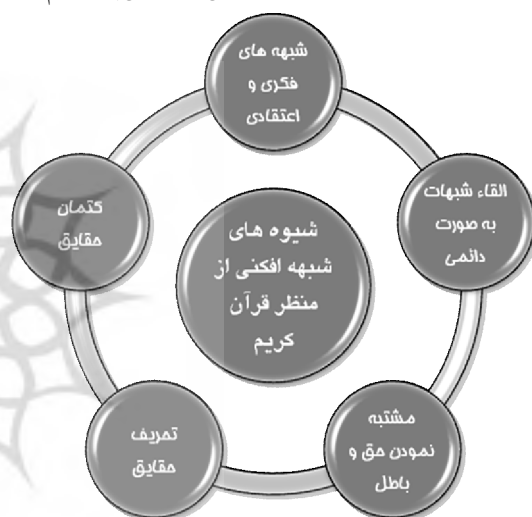
نمودار ۳. شیوه‌های شبه‌افکنی از منظر قرآن

ایجاد شبهه در جامعه به روش‌های مختلف صورت می‌گیرد. قرآن به مهمترین این روش‌ها، شیوه‌ها و مصادیق در آیات گوناگون اشاره داشته است که در این قسمت به بررسی آنها می‌پردازیم: