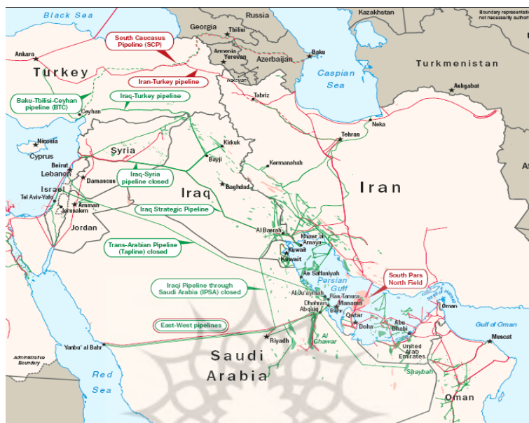
نقشه ۳: ذخایر نفت و گاز خلیج فارس (EIA, 2008, 1)

آن، از دیرباز مورد توجه قدرت‌های جهانی بود و تلاش برای اعمال سلطه و حفظ نفوذ در این منطقه به یکی از سیاست‌های راهبردی آنها تبدیل شده است.