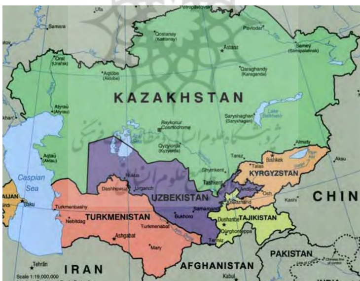
نقشه ۲: کشورهای منطقه آسیای مرکزی (Politicspeaksvalleys, 2009, 2)

همچنین این اولین بار است که نیروهای نظامی ایالات متحده در کمتر از ۲۰۰ مایلی مرزهای غربی کشور چین مستقر شده‌اند. وضعیت کنونی این احساس را به پکن القا می‌کند که تاکتیک محاصره با یک سد، توسط ایالات متحده علیه منافع این کشور در حال انجام است (Ferrari, 2003, 10). بر این اساس، چین مصمم است تا در برخی عرصه‌ها هماهنگ با جبهه‌ی مسکو در مقابل غرب ظاهر شود و در همین راستا با روس‌ها در چارچوب سازمان همکاری شانگهای ۲۲ پیش‌می‌رود و مایل است تا همکاری استراتژیک و نزدیکی را با اعضای این سازمان در برابر افزایش حضور ناتو و ایالات متحده در حیطه‌ی نفوذ خود در اوراسیای مرکزی پایه‌ریزی کند.