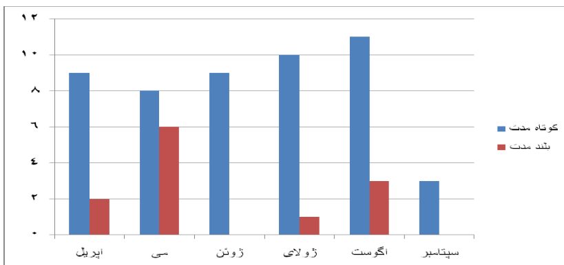
شکل (۲) نمودار تغییر ماهانه موج گرمایی بلند و کوتاه مدت در طی دوره مطالعاتی در استان کرمان

از سوی دیگر، این افزایش دما در بین فصول سال یکنواخت نیست و در نیمه گرم سال آهنگ افزایش دما نسبت به نیمه سرد سال بزرگتر بوده است. بنابراین، تفاوت دمای نیمه گرم و سرد سال در کشور رو به افزایش است و رژیم گرمایی کشور الگوی قاره‌ای پیدا کرده است (مسعودیان، ۱۳۸۷، ۶۵). پژوهش انجام گرفته مشخص می‌کند که ویژگی‌های ذکر شده در مورد آهنگ گرم شدن دما در ایران در مورد کرمان نیز صدق می‌کند؛ به طوری که این تغییرات در سال ۲۰۰۰ داری یک منحنی اوج بوده که این سال گرمترین سال در دوره آماری منطقه مورد مطالعه در کل ایستگاه‌هاست.