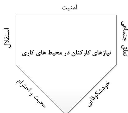
شکل ۱- مدل مفهومی پژوهش (نیازهای پنجگانه کارکنان در محیط های کاری)