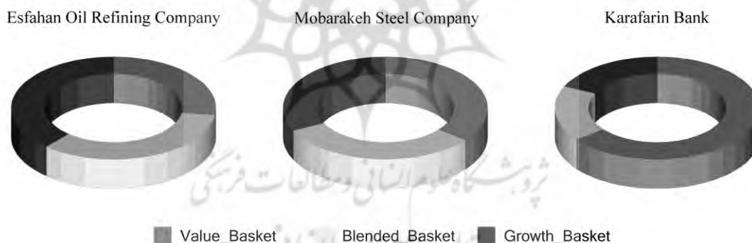
شکل ۲. نمودار حلقه ای برای شرکت‌هایی با ارزش سرمایه ای متوسط

نمودار حلقه ای (Doughnut chart) زیر نسبت عضویت در خوشه‌ها را برای شرکت‌هایی با ارزش بازاری سرمایه متوسط (پالایش نفت اصفهان، فولاد مبارکه و بانک کارآفرین) نشان می‌دهد. این نمودار همچنین برای مقایسه تطبیقی شرکت‌ها به کار می‌رود. چنانکه مشاهده می‌شود، در این گروه بانک کارآفرین