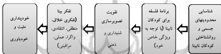
شکل 2. فرایند تبیین و ترسیم تفکری بینا برای کودکان نایبنا

این برنامه می‌تواند زندگی شخص را منقلب کند و زندگی اجتماعی او را نیز حفظ کند. از آن‌جا که نایبانی هرگز مانع رشد و ترقی نمی‌شود، استفاده از راهبردهای تقویت حس شنوایی در نایبانیان اعتماد به نفس آنان را در بین مردم جامعه افزایش می‌دهد و، با تغییر نگرش آن‌ها به نگرش مثبت، باعث افزایش عزت نفس می‌شود. از این‌رو شکل‌گیری تصویر ذهنی فرد نایبنا منجر به افزایش و تثبیت «حرمت خود» می‌شود. فرایند پژوهش در شکل 2 نمایش داده شده است.