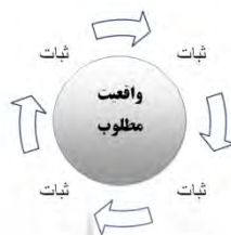
مدل نهایی: فرایند مدیریت رسانه‌ای بحران از طریق بازنمایی تصویر واقعیت

مدل نهایی زیر که بر اساس تحلیل‌ها و بررسی‌های حاضر در این مقاله تبیین و ارائه شده است، درحقیقت مدلی است که تعامل حکومت، رسانه، و مردم را به‌منزله سه بازیگر اصلی در بحران‌ها، به‌خصوص بحران‌های سیاسی، به تصویر کشیده است. مدلی که درنهایت «از طریق مدیریت ادراک و تغییر و هدایت نگرش‌ها، بر عملکرد و واکنش مخاطبین خود تأثیر خواهد گذاشت» (نقیب‌السادات، ۱۳۸۷).