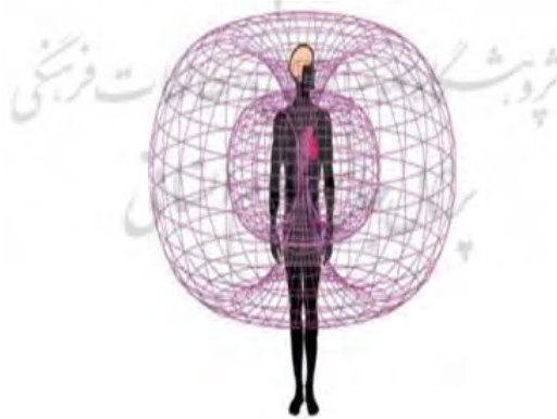
شکل ۱. میدان الکترومغناطیسی حاصل از سیگنال‌های الکتریکی در نورون‌های اعصاب مرکزی در قلب و اطراف سر

سیگنال‌های الکتریکی در نورون‌های اعصاب مرکزی می‌توانند میدانی الکترومغناطیسی در اطراف خود ایجاد کنند که این میدان گستره بالایی دارد و می‌تواند تا فاصله نیم‌متری اطراف سر میدان درخور ملاحظه‌ای را ایجاد کند (شکل ۱). در این جا به بررسی نوع تفکرات بر مبنای این میدان می‌پردازیم (Perlovsky, 2010; Funk et al., 2009).