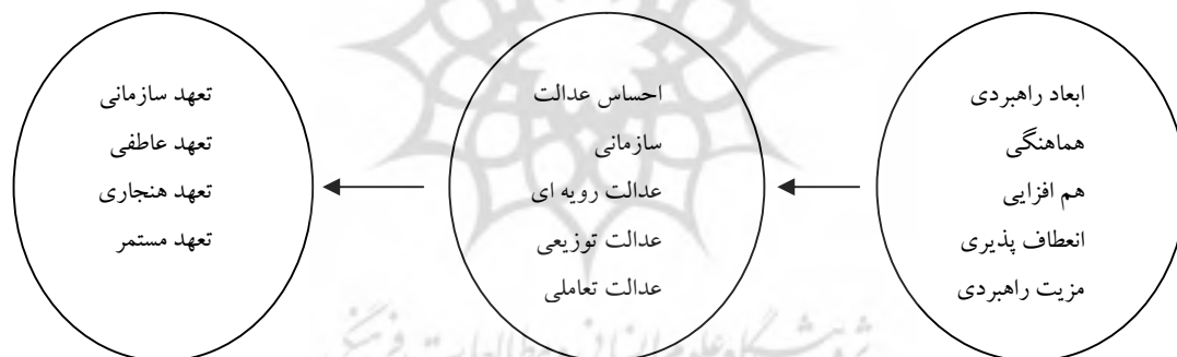
شکل شماره ۱: الگوی مفهومی پژوهش

مرور مبانی نظری و پژوهش‌های داخلی و خارجی نشان می‌دهد که متغیرهای پیشنهادی این تحقیق به طور مستقیم و یا غیر مستقیم، در چهارچوب الگوهای متفاوت (دو یا چند متغیره) دارای رابطه است. در این تحقیق تلاش شد با توجه به مبانی نظری موجود، تأثیر میانجیگری احساس عدالت سازمانی بر روابط بین ابعاد راهبردی و تعهد سازمانی تبیین شود.