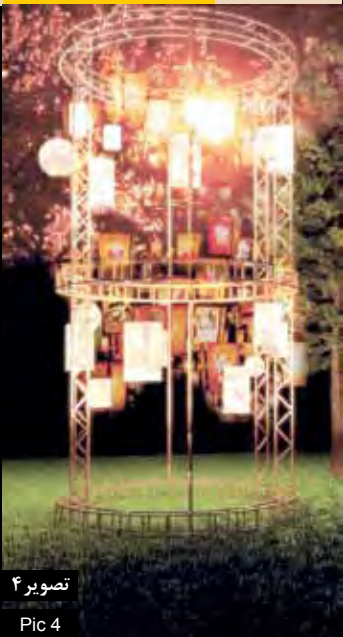
تصویر ۴ Pic 4