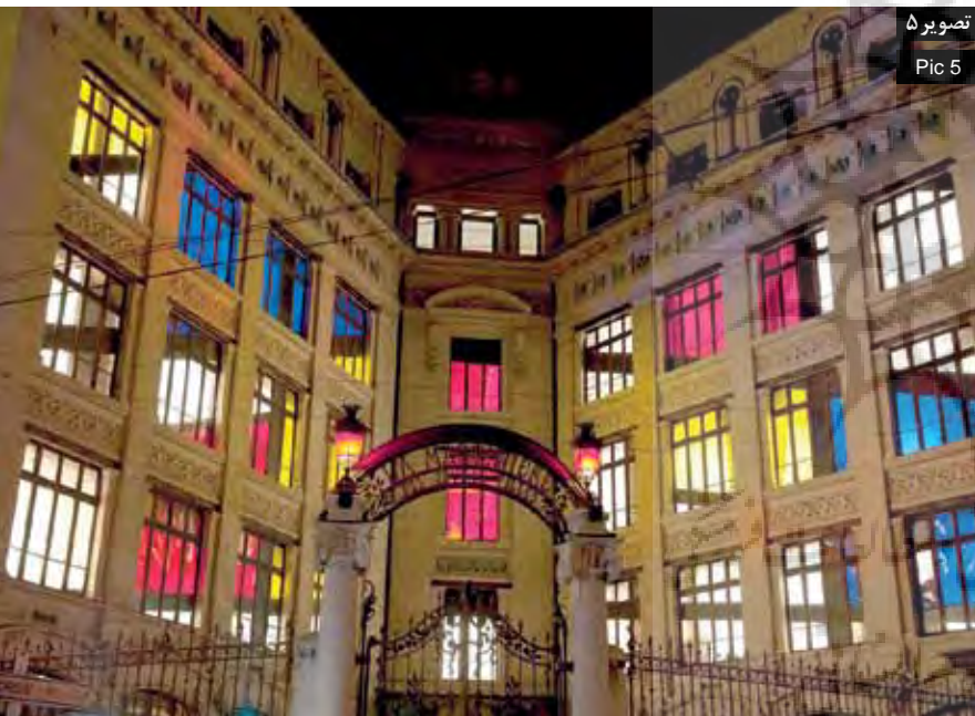
تصویر ۵ Pic 5

تصویر ۵: پروژه آماتوری، دبیرستان لامانتینر با الهام از آثار موندریان، جشن نور لیون ۲۰۱۰، فرانسه. Pic 5: School of La Martinière, one of the students experiments inspired from Piet Mondrian abstract painting, Festival of lights 2010, Lyon, France.