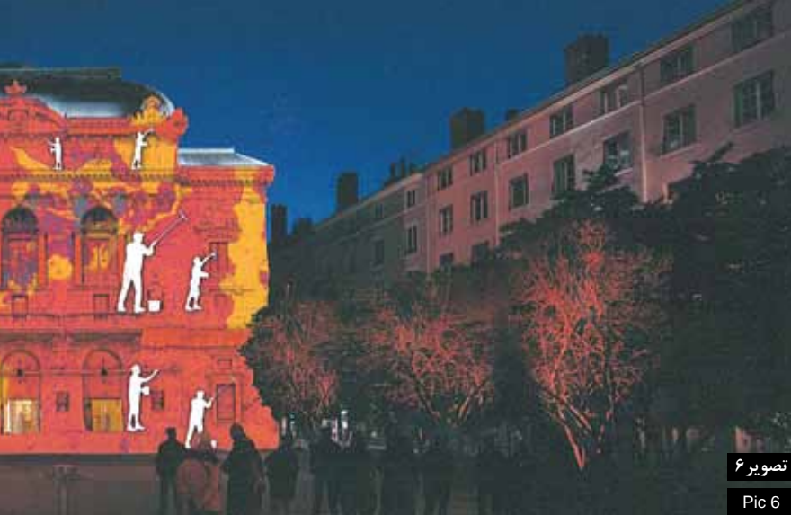
تصویر ۶ Pic 6

تصویر ۶: میدان سلسنتن، نمایش ترکیبی تصویر و معماری با استفاده از تکنیک‌های مجازی، لیون، فرانسه. Pic 6: Place des Celestins, Archipictural animation by virtual technics, Lyon, France.