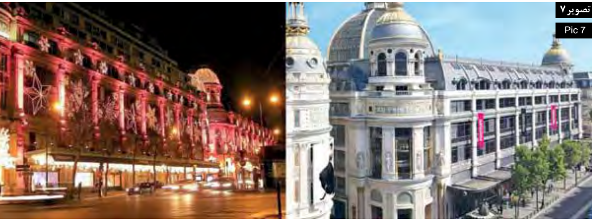
تصویر ۷ Pic 7