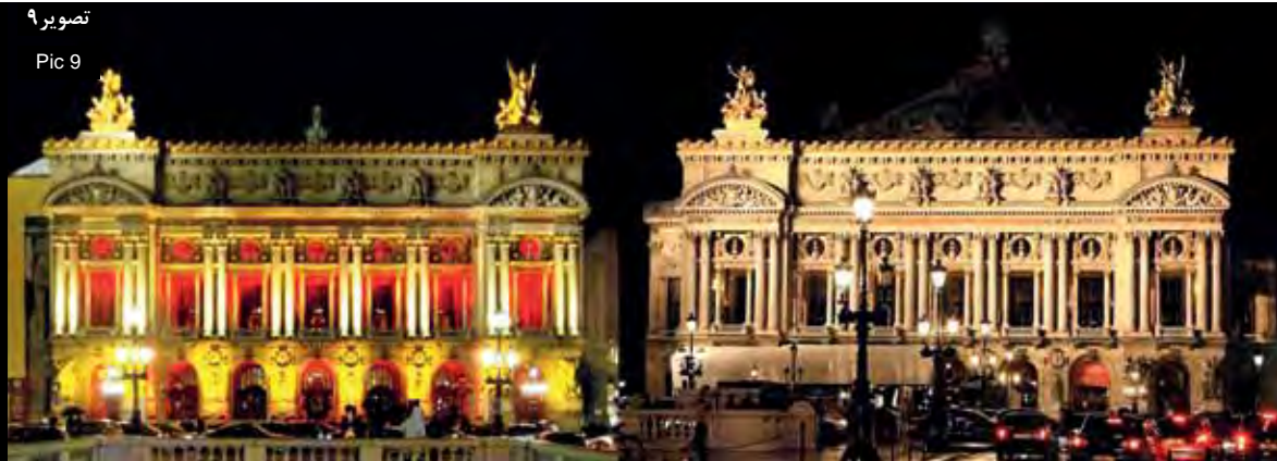
Pic9: Paris opera: ordinary nights and events. The night view deletes or wipes out a number of elements and makes the visitors look at the direction that the designer leads them. Paris, France.