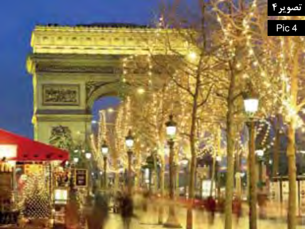
تصویر ۴ Pic 4