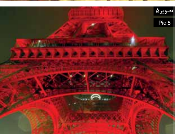
تصویر ۵ Pic 5