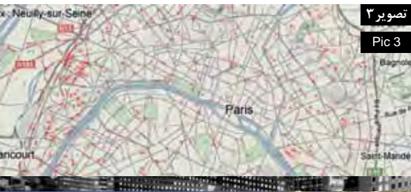
تصویر ۳ Pic 3