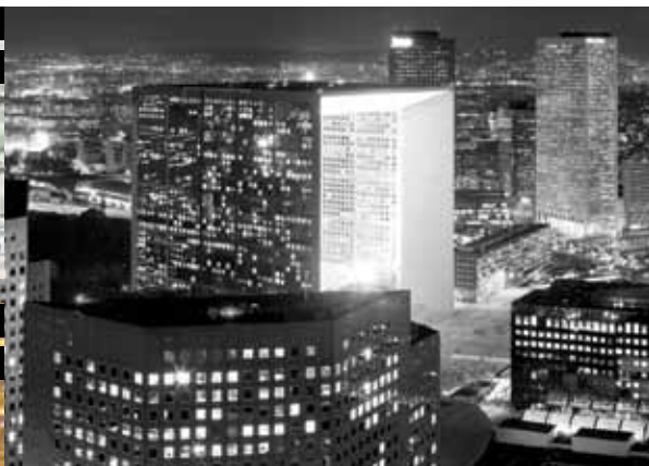
تصویر ۱ Pic 1