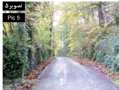
تصویر ۵ Pic 5