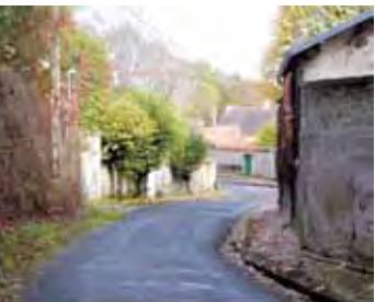
تصویر ۳: نقشه ساختار منظر منطقه له‌سون (Les Cévennes)، فرانسه.

در اوایل قرن نوزدهم، شهر در اثر رشد و گسترش با مشکلات امنیتی مواجه می‌شود که