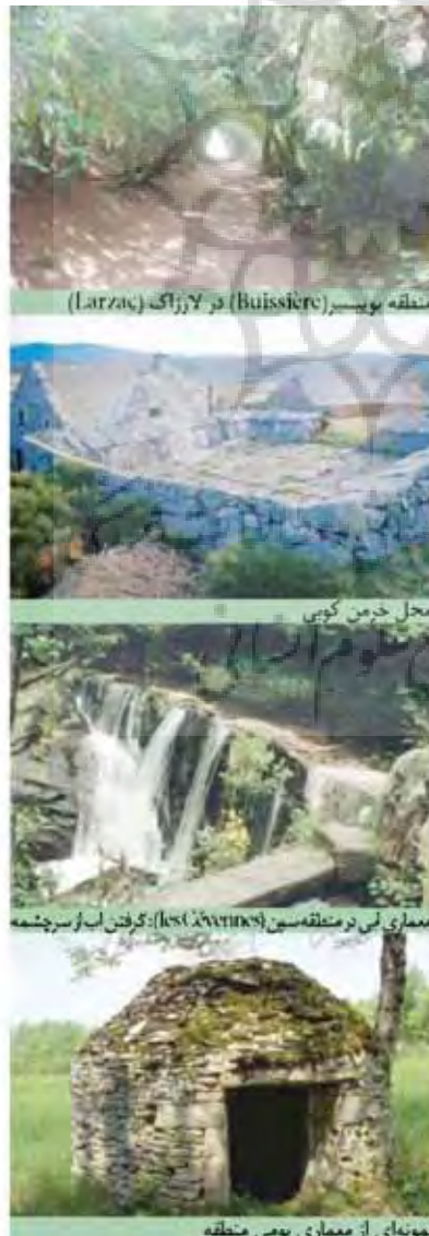
منطقه بویسییر (Buissière) در لارزاک (Larzac)