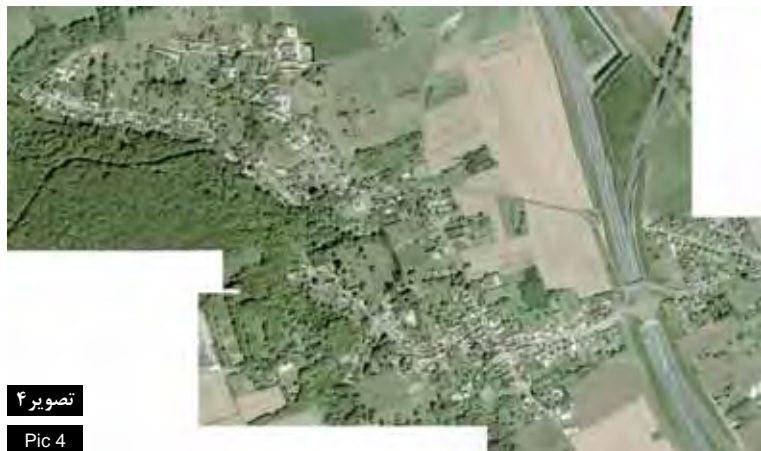
تصویر ۴ Pic 4

Keywords: Landscape, Nature, Human activities, Rural- city, Urban landscape.