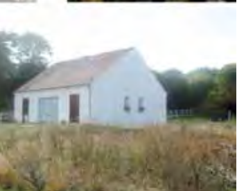
تصویر ۵: منظر منطقه وکسن (Vexin)، فرانسه.

Pic4. Vexin natural park location on Paris urban area border, France.