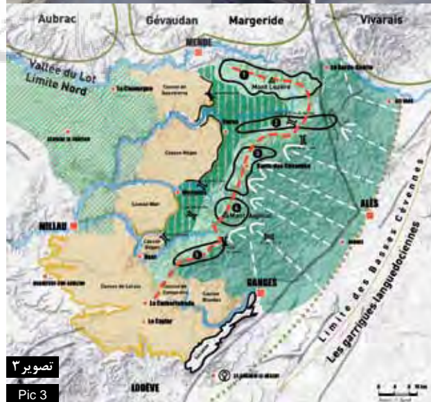
تصویر ۳ Pic 3