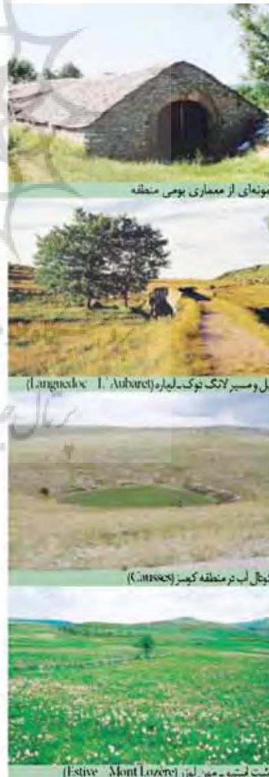
نمونه ای از معماری بومی منطقه