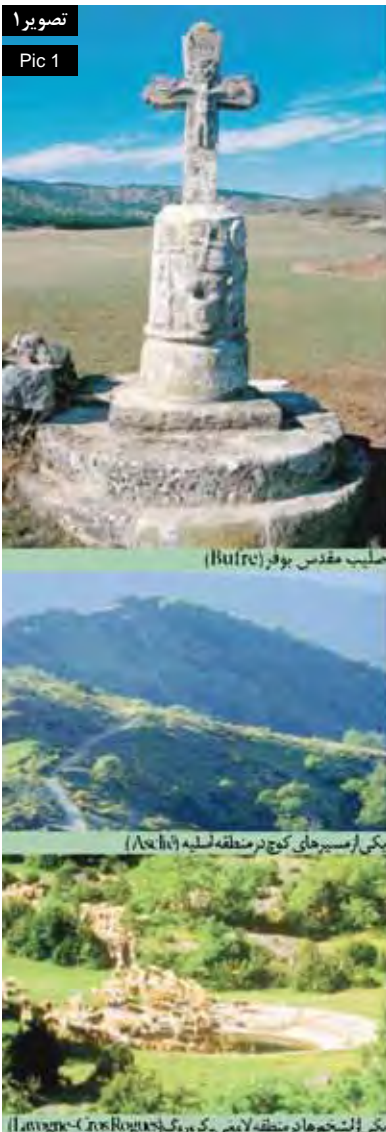
عملیب مقدس بوفر (Bulre)