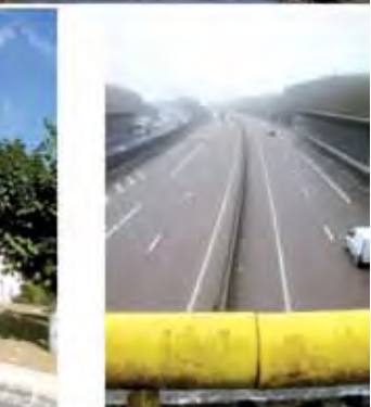
تصویر ۴: موقعیت پارک طبیعی وکسن (Vexin) در مرز ناحیه شهری پاریس، فرانسه.

Pic3. Landscape structure plan of Les Cévennes region, France.