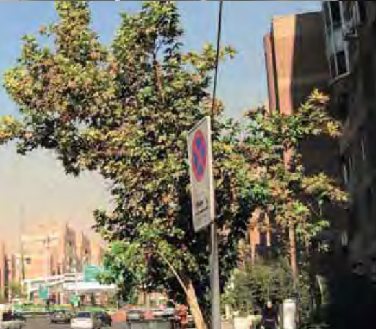
تصویر ۳: ورودی تونل توحید در بزرگراه نواب، عکس: زهرا عسکرزاده، ۱۳۹۱.