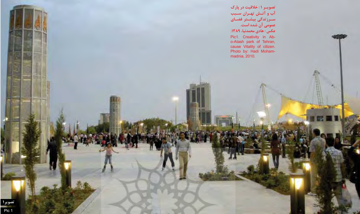
تصویر ۱ Pic 1