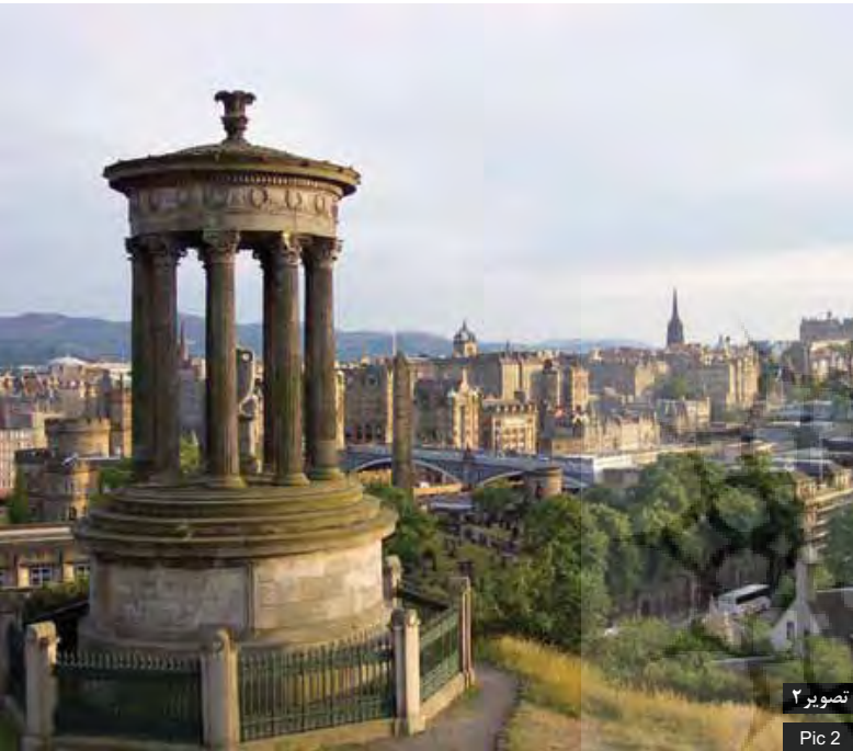
تصویر ۲ Pic 2

تصویر ۲: دورنمای دانشگاه لیورپول هوب، مأخذ: http://www.designstudier.no Pic2. Liverpool Hope University landscape, Source: http://www.designstudier.no.