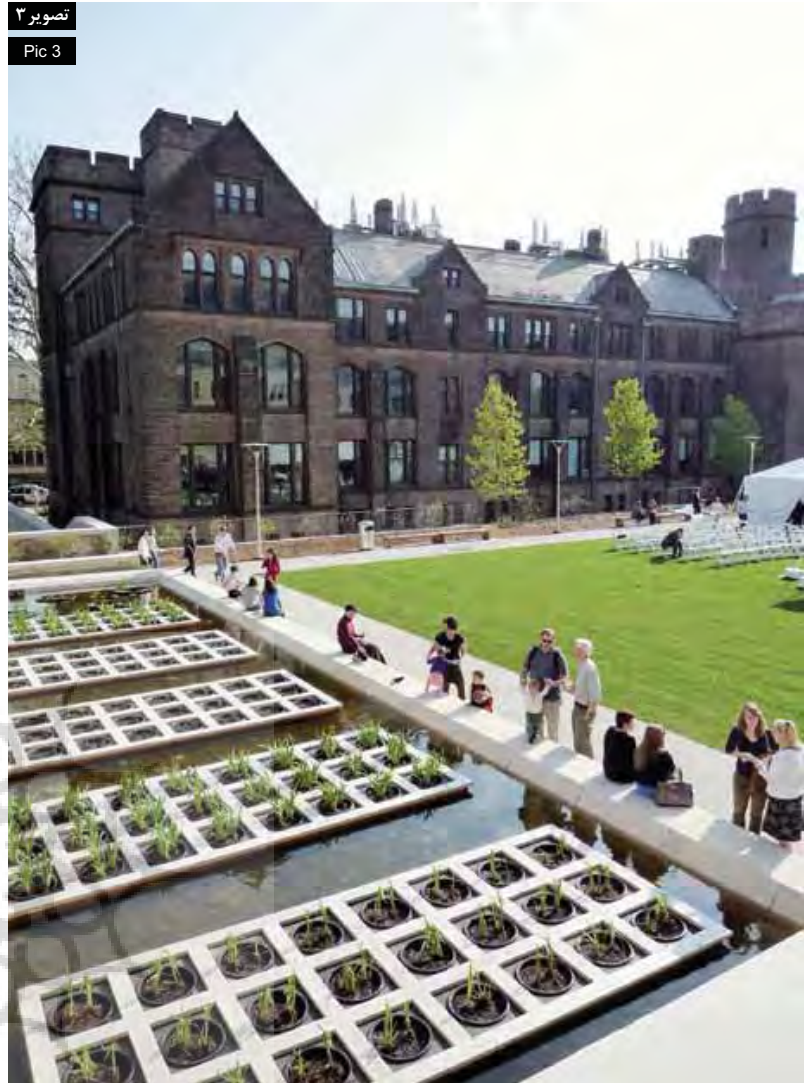
تصویر ۳ Pic 3

در یکی از جلسات مجلس آمریکا (American Assembly)، نقش گسترده و عمومی آموزش عالی در جامعه و همچنین نقش‌های موازی از هنرهای نمایشی در چند روش شرح داده شده است (Fisher & Mortimer, 2004: 3):