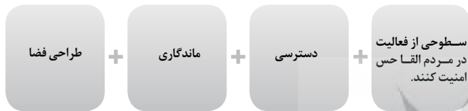
Chart 2: Environmental features to achieve safe and healthy environment, Source: Authors.

نمودار ۲: ویژگی‌های محیطی جهت دستیابی به محیط امن و سالم، مأخذ: نگارندگان.