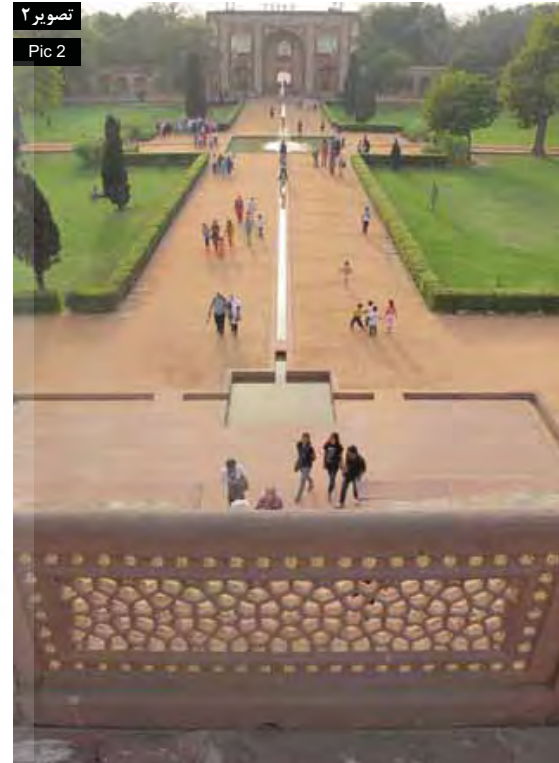
تصویر ۲ Pic 2