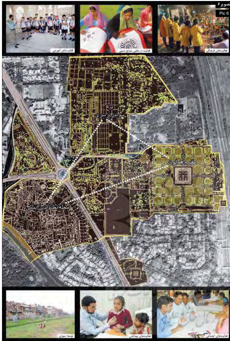
تصویر ۶ Pic 6

انسان در محیط شهری نیز می‌شود. این رویکرد در طراحی به صورت شبکه‌ای از فضاهای بیرونی شهری امروز می‌تواند مورد استفاده قرار گیرد.