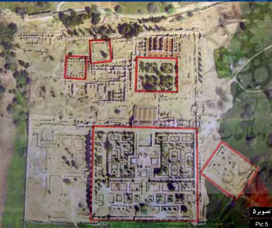
Pic5: Madīnat az-Zahrā is an urban palace which evokes Persian gardens. It has geometrical form except the northern border that shaped organic because of locating on a slope. Madīnat az-Zahrā is also divides in to smaller spaces which are in geometrical form. Cordoba, Spain. Photo by: Mohamad Atashinbar, 2007.

مهم‌ترین ویژگی باغ‌های آندلسی اینست که در ساختار خرد فضای خود از اجزای هندسه‌مندی تشکیل شده‌اند و از کنار هم گذاشتن آنها به کلیتی می‌رسیم که فاقد هندسه مشخصی بوده و تابع زمینه خود هستند.