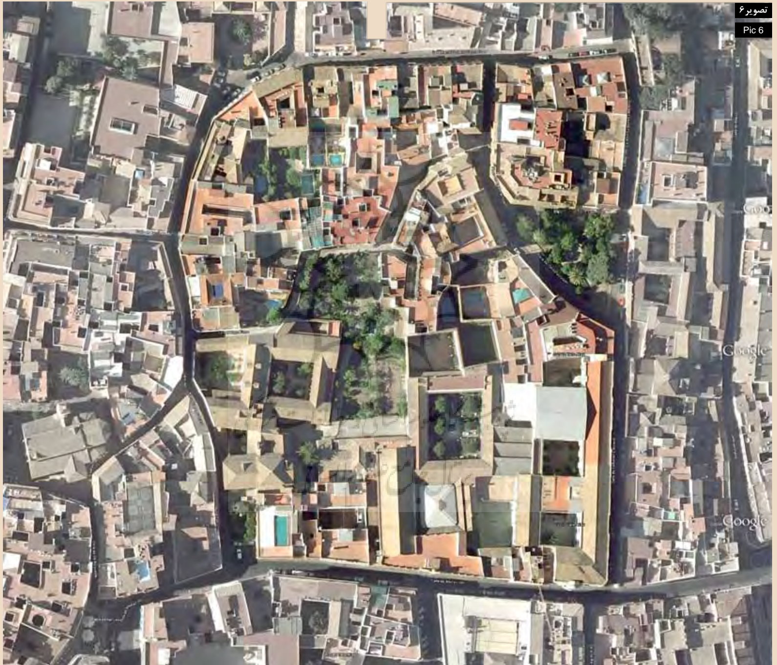
تصویر ۶ Pic 6

Pic6: Home patios are also divide in to smaller spaces.