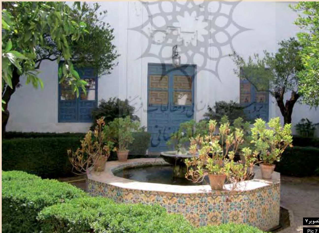
تصویر ۷: نمونه‌ای از فضای یک حیاط در خانه آندلسی. کوردوبا، اسپانیا.

شاید بنا بر آنچه قبلاً نیز ذکر شد، وجود هندسه قابل درک از درون فضا و بکارگیری این نظم در سامان‌دهی فضاهای باز در قیاس با کلیت نامنظم مجموعه‌ها، نشأت گرفته از الگوی مجموعه‌های شهری ایرانی باشد. باغ ایرانی در هر جا که مقدور بوده مستطیلی از زمین را به خود اختصاص داده و بی‌توجه به شکل محیط و اقتضای آن زیبایی‌شناسی خود را اعمال کرده است (منصوری، ۱۳۸۴). به هر حال نظم هندسی در نظام خرد فضایی باغ‌سازی آندلس در تمامی نمونه‌های کوچک و بزرگ مورد بازدید در مطالعه میدانی، وجود دارد و می‌توان آن را جزو اصول کلی این سبک برشمرد.