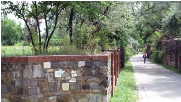
تصویر ۱۰: استفاده از مصالح باقیمانده در سایت صنعتی در جداره‌سازی. پارک دورا، تورین، ایتالیا.

Pic10. Creating an exciting dialogue between old and new.