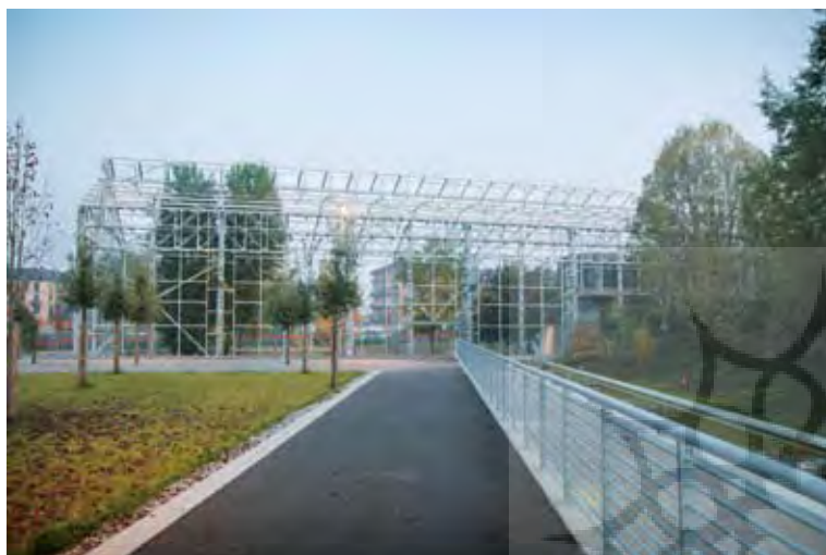
تصویر ۸: پارک در ارتباط قوی با بناهای مسکونی اطرافش طراحی شده است. پارک دورا، تورین، ایتالیا. Pic8. Linking the park with the housing development .