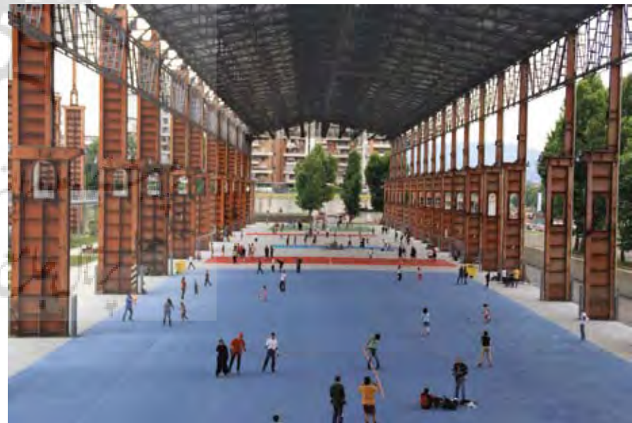
Pic7. Peter Latz calls The 30 meter highhall roof of the former vitaliron factory a "Technical Canopy" and compares it to Anatural canopy of trees, intended to offer alarge number of leisure activities in the future.

تصویر ۷: پیتز لاتز سقف بتنی باقی‌مانده از یکی از بناهای موجود در سایت را به سایبان فنی تشبیه کرده و آن را با سایبان طبیعی یک درخت مقایسه می‌کند. پارک دورا، تورین، ایتالیا.