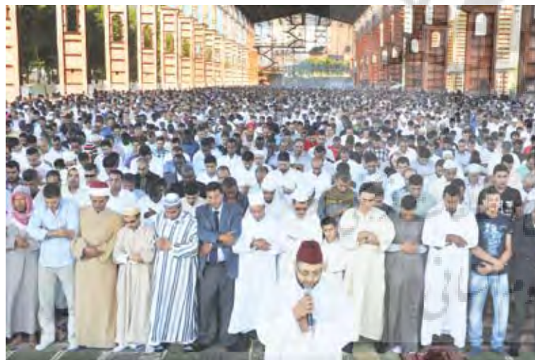
تصویر ۱۱: فضای جمعی چند عملکردی. پارک دورا، تورین، ایتالیا. Pic11. Parco Dora for public infrastructure that can be used on a daily basis.