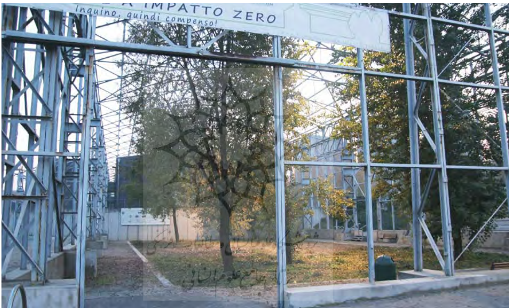
تصویر ۹: یکی از ورودی‌های پارک دورا. تورین، ایتالیا.

Pic9. The architectural and garden design of the sunken tranquility garden on the Harbour Island borrows unmistakably from historical models.