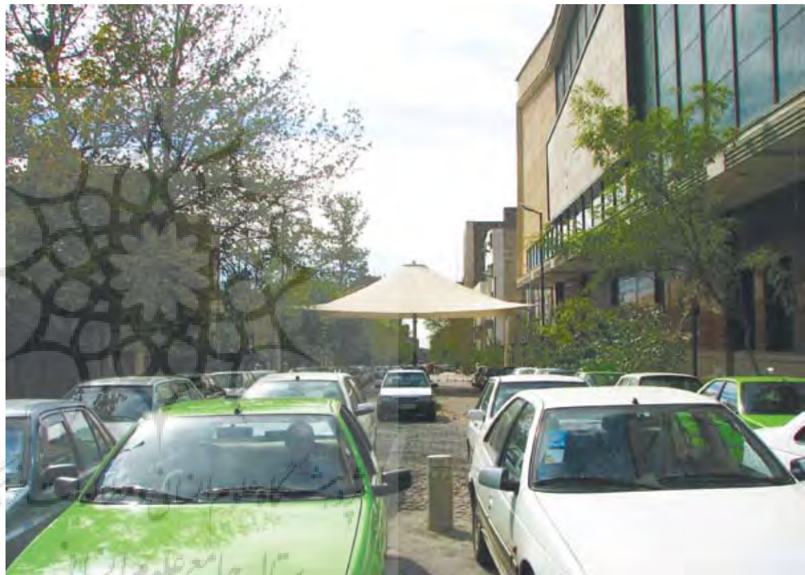
تصویر ۲: وضع موجود پیاده‌راه خیابان صبا در شهر تهران. عکس: رسول رفعت، ۱۳۸۹.

ادراک ما از شهر که آن را منظر شهری می‌نامیم (منصوری، ۱۳۸۹: ۳۴-۳۲) به عوامل مختلفی وابسته است که پیاده‌راه در آن نقش مهمی ایفا می‌کند. می‌توان ادعا نمود اساساً درک ما از شهر، چیزی بر اساس فهم