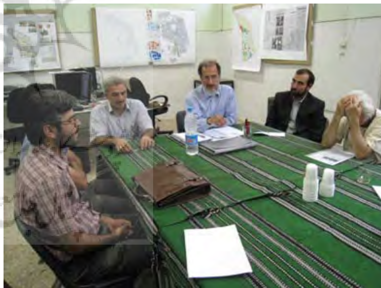
تصویر ۴ : جلسه مدیریتی با اوقاف.