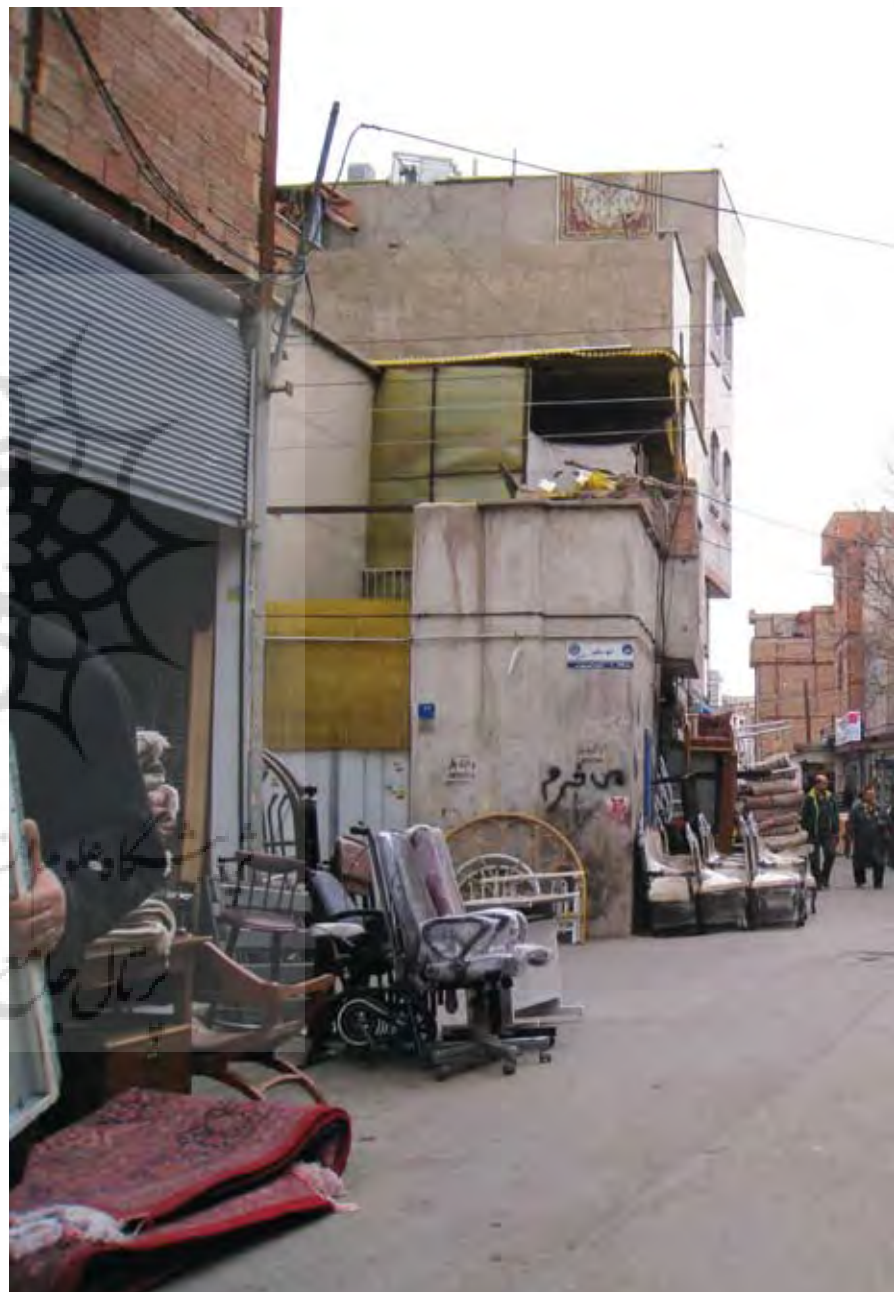
تصویر ۱: کارگاههای تولید مبلمان.

Key Words: urban decay renewal, renewal office, Nemat Abad sector, Participation, Citizen, Tehran