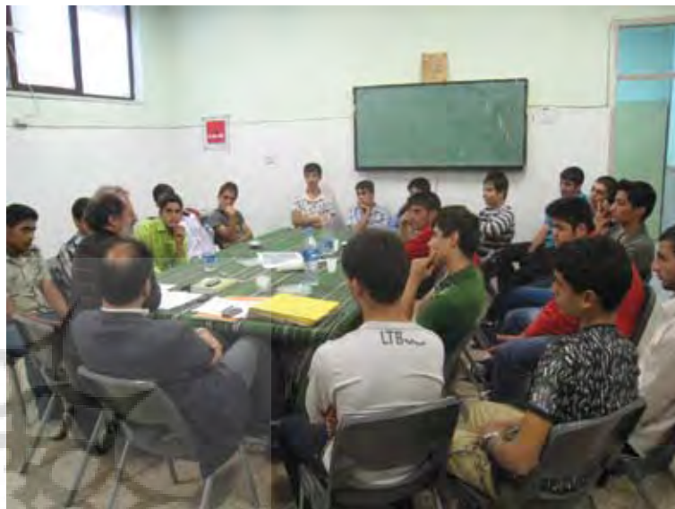
تصویر ۳ : کلاسهای هنر مهندسی. ۱۳۸۹.