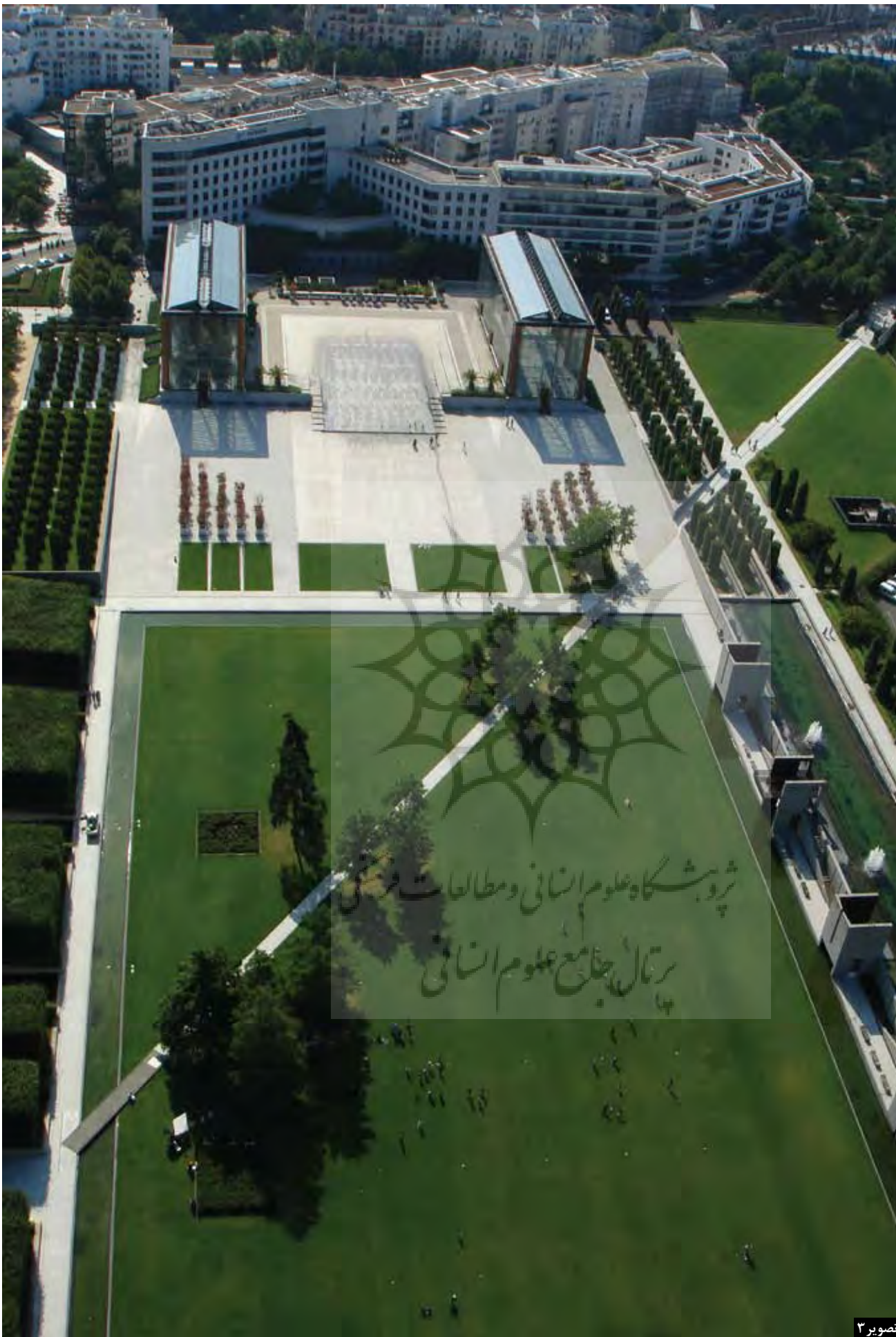
تصویر ۳: محور مورب میانی در فضای منعطف چمن یک مسیر عبوری ایجاد می کند و بخش های مختلف پارک را به هم می پیوندد.