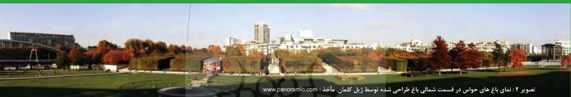
تصویر ۲: نمای باغ‌های حواس در قسمت شمالی باغ طراحی شده توسط ژیل کلمان.

واژگان کلیدی: ژیل کلمان، پاریس، پارک سیتروئن، پست مدرنیسم