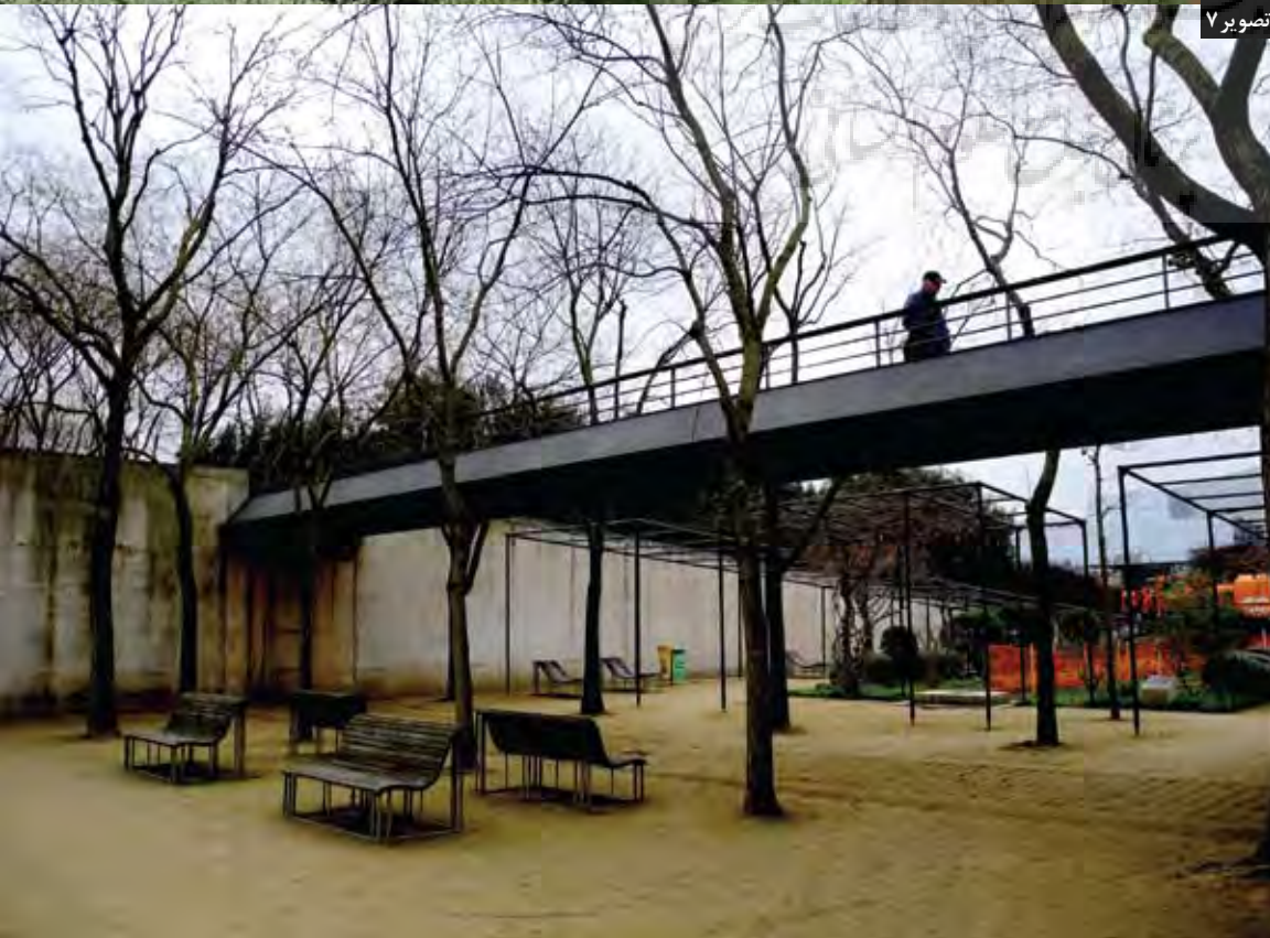
تصویر ۵ تصویر ۷

در این پارک، گیاهان نقش‌های متفاوتی را در منظره‌سازی ایفا می‌کنند. در طراحی فضاهایی چون باغ سیاه و باغ سفید، منظره‌پردازی براساس رنگ گیاهان و تضاد آن با رنگ زمینه صورت گرفته است. این استفاده از رنگ، مؤید رویکرد پست‌مدرنیستی در طراحی این پارک است؛ زیرا رنگ عنصری است که پیش از دوران مدرنیسم و در دوران سنت در منظره‌پردازی و بناها مورد استفاده قرار می‌گرفته است. در گذشته، گیاهان را با توجه به رنگ و فرم‌شان انتخاب می‌کردند. در اینجا نیز عمل گزینش براساس رنگ انجام شده و رنگ، اساس منظره‌پردازی قرار