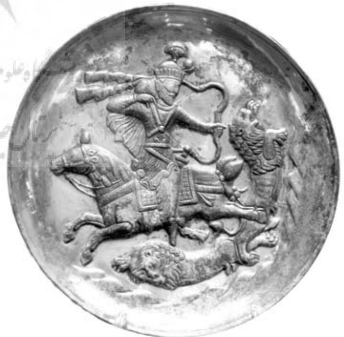
تصویر ۱-۱: بشقاب زرین و سیمین منقوش به تصویر شاهنشاه ساسانی شیرافکن. موزه تبریز. مأخذ: نگارنده.

واژگان کلیدی: عهد ساسانی، فرهاد تراش بیستون، معبد اناهیتای کنگاور، طاق بستان، دسکره.