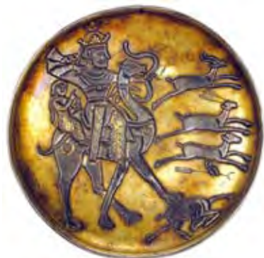
تصویر ۱-۳: بشقاب سیمین زراندود با نقش قلم‌زنی شده: بهرام پنجم و دخترش آزاده سوار بر شتر در حال شکار آهو. محل نگهداری: موزه ارمیتاژ، روسیه.

Keywords: Sassanid era, Tarāš-e Farhād of Bisotun, Anaitis temple in Kangāvar, Tāq-e Bostān in Kermānshāh, Daskara (Persian for hunting-park & pavilion).