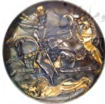
تصویر ۱-۲: بشقاب سیمین زراندود با نقش شکار شیر توسط پادشاه شاپور دوم ساسانی. محل نگهداری: موزه ارمیتاژ، روسیه.

چکیده: در متون تاریخی کلاسیک به شواهدی از معماری محیط و منظر و دسکره در ناحیه کرمانشاهان و بیستون عهد ملوک عجم و آکاسره اشاره شده است. از قدیمی‌ترین آنها «الأعلاق النفسیه» اثر «ابن رسته» (۲۹۰ ه. ق) و «المسالک الممالک» نوشته «اصطخری» (ح. ۳۲۰ ه. ق) به یادگار مانده است. شواهد باستان‌شناختی موجود، صحت این گزارش‌های تاریخی را تأیید و تأکید می‌کند که سه شکارگاه سلطنتی بیستون، طاق بستان و کنگاور تنها نمونه‌های نادر و منحصر به فرد از معماری محیط و منظر و ساخت کوشک و دسکره در ایران باستان هستند که تاکنون کشف و گزارش شده‌اند.