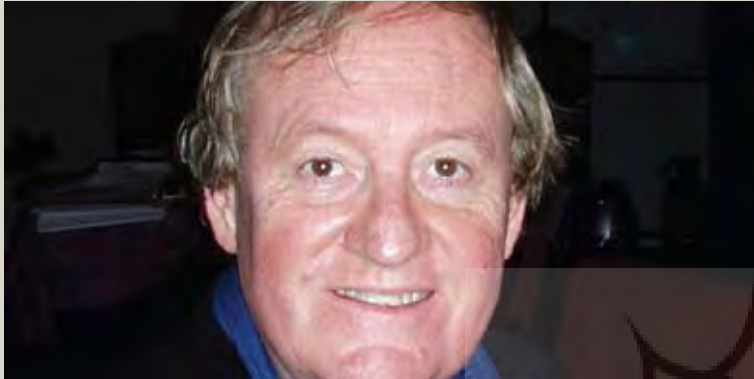
ژان پیر لودانتک

همراه با انجام فعالیت‌های حرفه‌ای خود، از جمله طراحی استراحتگاه‌های بین‌راهی (پروژه کسارک، بزرگراه آ.۴، نیم)، در طرح‌های منظر بزرگراه (معدن سنگ کرازان در نزدیکی سنت)، پارک ساحلی یا «باغ بازگشت» در روشفور، سعی کرد بسیاری از نظریات جدید خود را در کانسپت کارهایش ارائه نماید (تحلیل حسی، غیر قابل اندازه‌گیری، لایه‌های منظرین، رابطه، بسته‌بندی و غیره). وی یافته‌هایش را با گروه متخصصان میان‌رشته‌ای متشکل از یک جغرافی‌دان (اگوستن برک)، فیلسوف (آلن راجر)، مورخ-جامعه‌شناس (میشل کونان) و سایر معلمان (از جمله نگارنده) به اشتراک گذارد. سپس این گروه بر روی نظریه و تاریخ باغ‌ها و منظرها برای راه‌اندازی دیپلم مطالعات پیشرفته (DEA) در مدرسه معماری لاویلت پاریس، با همکاری مدرسه عالی مطالعات علوم اجتماعی اقدام کرد، که تحت عنوان برنامه دکتری «باغ، منظر، قلمرو» تا سال ۲۰۰۸ ادامه داشت. وی تحقیقات خود را پس از بازنشستگی در فرانسه، به عنوان یک معلم پژوهشگر در دانشگاه پنسیلوانیا به همراه جان دیکسون هانت (مؤسس مجله تاریخ باغ) ادامه داد. مجموعه این سوابق هنری و نظری او را لایق دریافت جوایز متعدد در فرانسه (جایزه بزرگ منظر، ۱۹۹۶) و در سطح بین‌الملل (مدال طلای سر جفری جولویو، ایفلا - یونسکو، ۲۰۰۹) نمود.