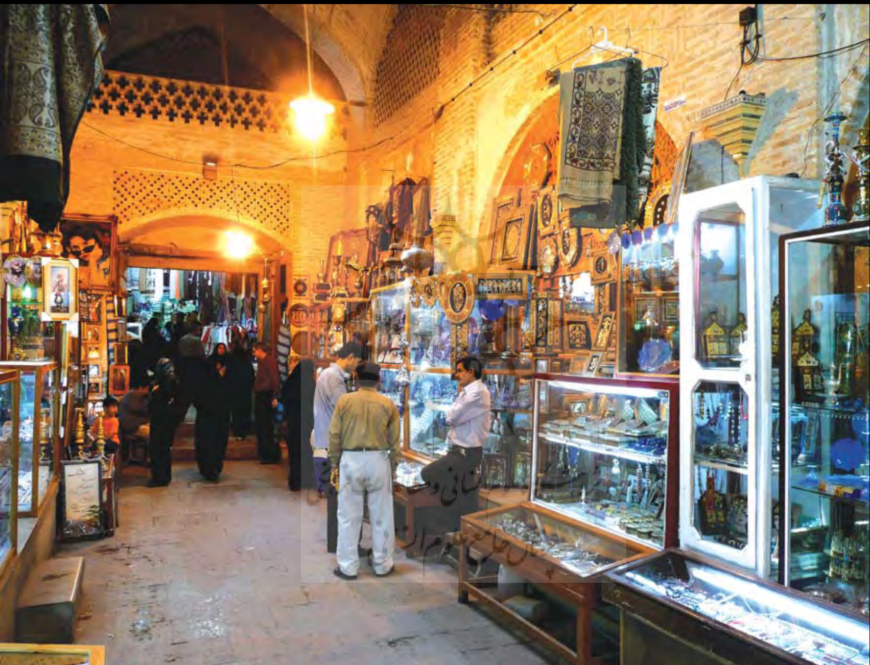
تصویر ۳: نمایش الگوی کار و فروش صنایع دستی ایرانی در سرای مشیر شیراز. عکس: سینا رزاقی اصل، ۱۳۸۸.