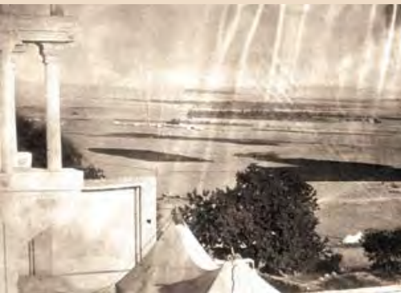
تصویر ۲: ایوان عمارت نیاوران و دشت شمیران، ۱۲۸۰ ق.