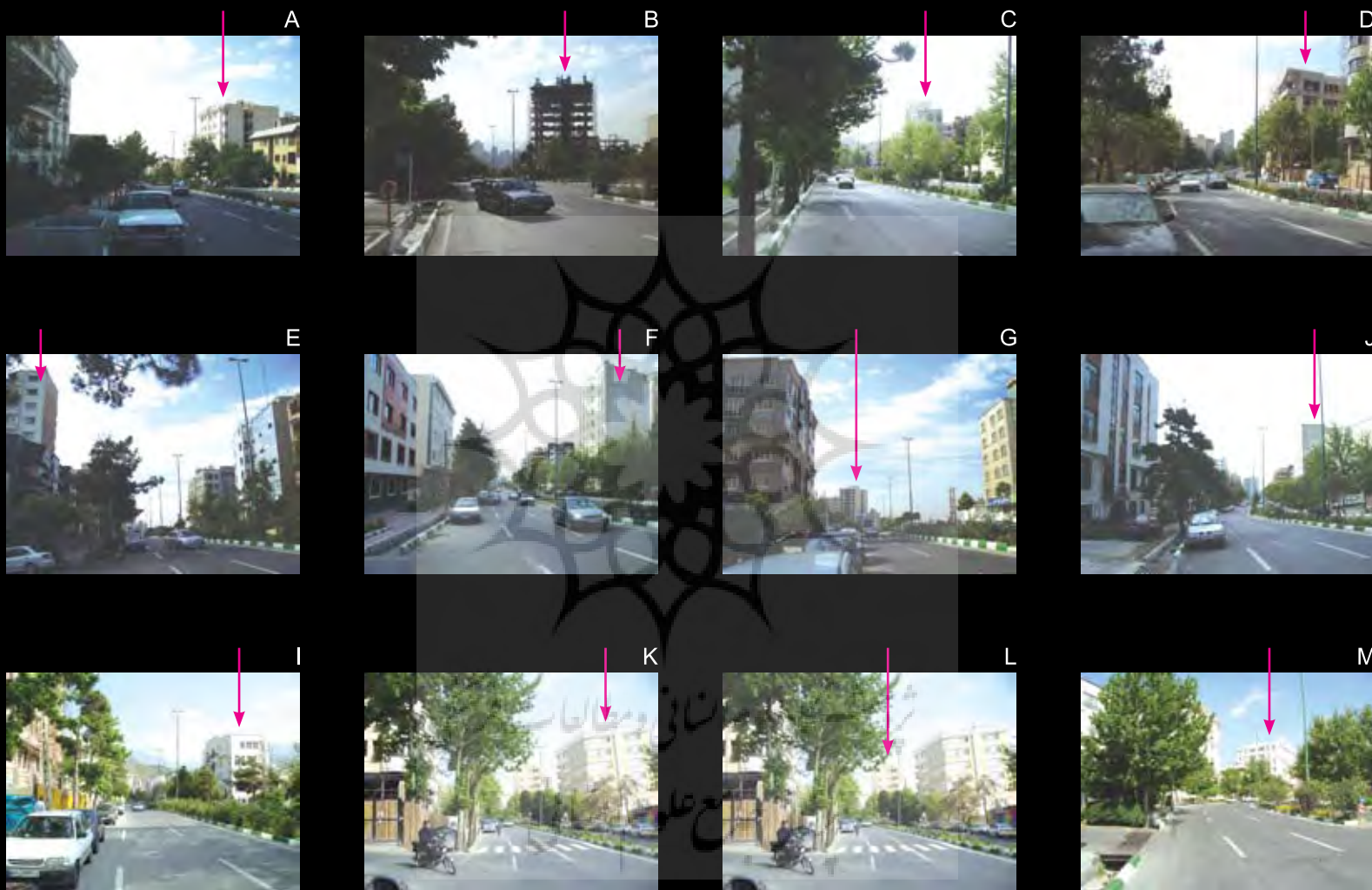
شکل ۱: کدهای مربوط به بناهای مورد بررسی در بلوار ۲۴ متری سعادت آباد