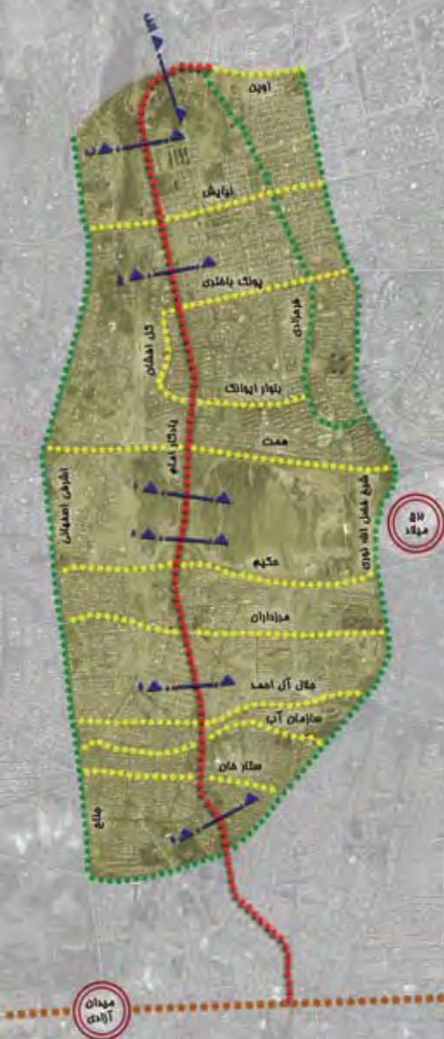
تصویر ۱۴ : موقعیت بزرگراه یادگار امام و بزرگراه‌های همجوار، مأخذ: نگارنده.