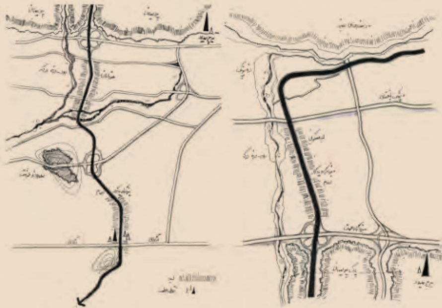
تصویر ۱۳ : ساختار بزرگراه یادگار امام و لبه‌های طبیعی و مصنوعی، مأخذ: مرجانه زندی، ۱۳۸۸.