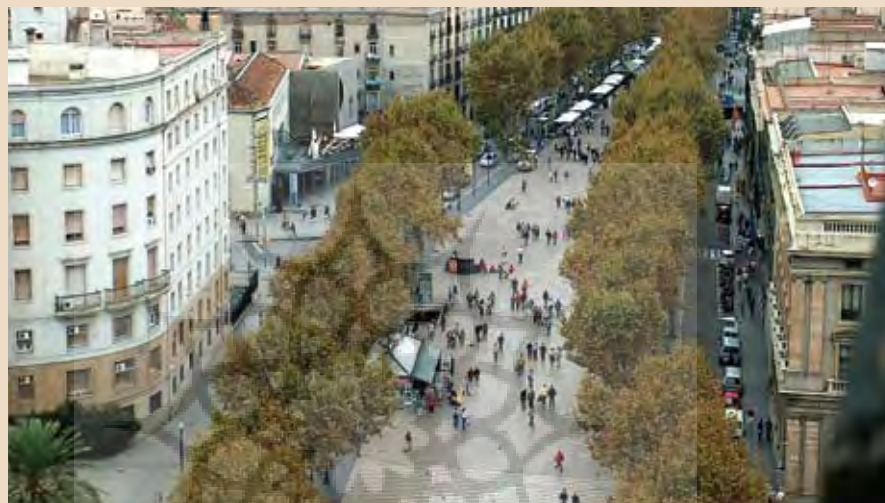
تصویر ۱۲ : گذر رملا بهترین نشانه و لبه شهری بارسلون، مأخذ: www.barcelona-spain.ca

تردد بسیاری از افراد در روز بوده و در معرض دید شهروندان متعددی است و همین مسئله بر اهمیت آن افزوده و باعث شاخص‌تر شدن آن نسبت به دیگر لبه‌های شهری در این مقیاس می‌شود.