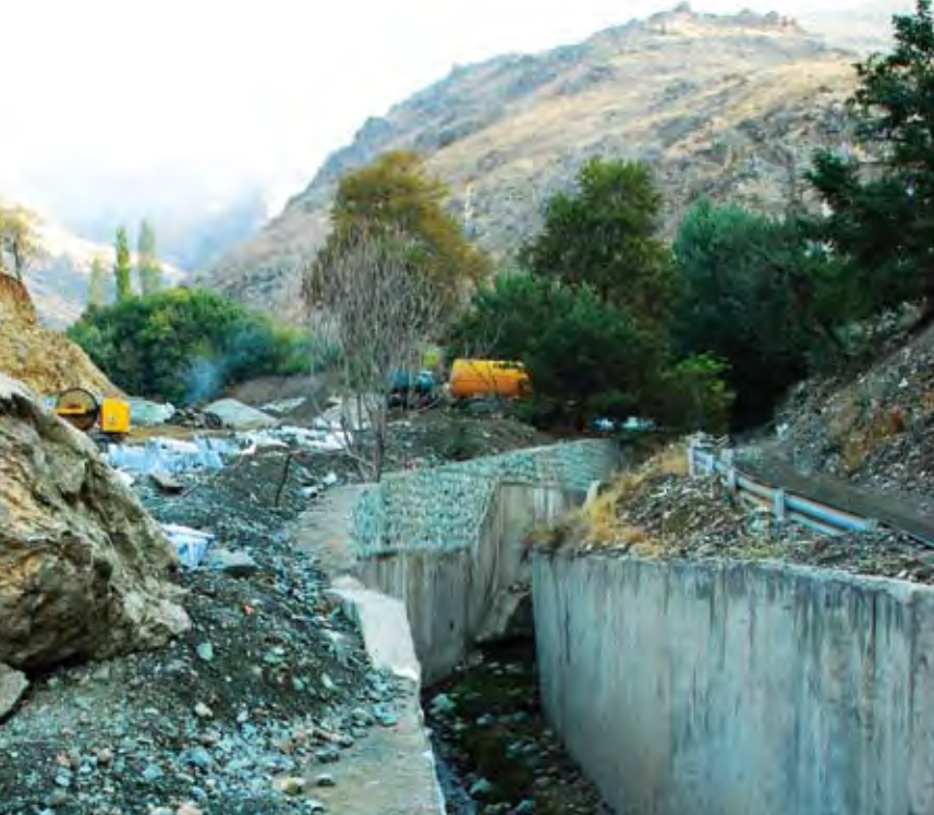
تصویر ۵: گلابدره تهران، عکس: سید محمد باقر منصوری، ۱۳۸۹.