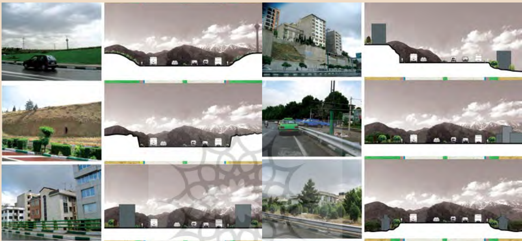
تصویر ۱۶: مقطع طولی بزرگراه یادگار امام، مأخذ: نگارنده.