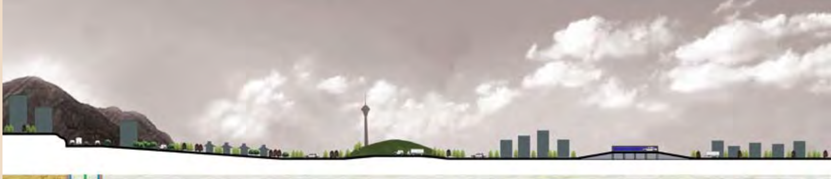
تصویر ۱۵: مقطع طولی بزرگراه یادگار امام، مأخذ: نگارنده.