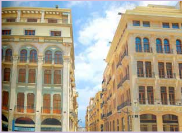
پس از بازسازی