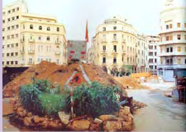
۴: تمامی ساختمان‌های آسیب‌دیده در جنگ لبنان حتی با ۹۰ درصد درجه تخریب، دوباره برپا شده است.

هتل و رستوران را ما نیز در یزد و اصفهان و شاید یکی دو شهر تاریخی دیگر داریم، اما هتل‌ها و مهمان‌پذیرهایی که در خیابان‌های «ناصر خسرو» و سایر خیابان‌های مرکز تاریخی شهر تهران قرار دارد، واقعا درخور نیست و حتی یک ستاره هم محسوب نمی‌شود. از سوی دیگر تمام هتل‌های بزرگ در شمال شهر قرار دارد و از تنوع قیمت برای تمام اقشار و طبقات برخوردار نیست.