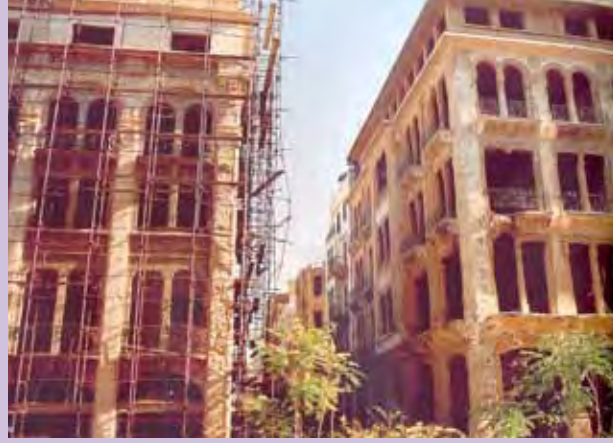
قبل از بازسازی