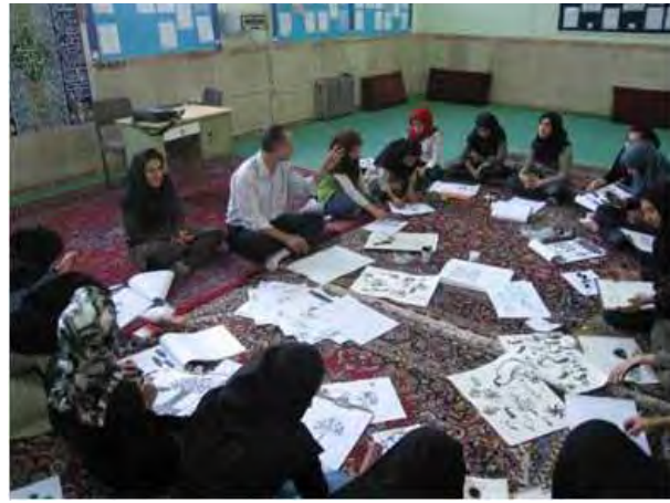
۲ و ۳: آموزش برای قشرهای مختلف محلی و همکاری آنها در مرحله مطالعات نوسازی، عکس: نگارنده.