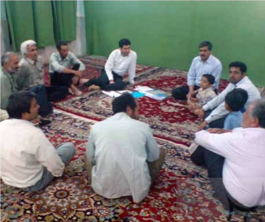
۴: استفاده از نیروهای محلی، سهم عمده‌ای در ایجاد اعتماد، شفاف‌سازی و اطلاع‌رسانی در محله دارد، مأخذ: www.persianguig.com