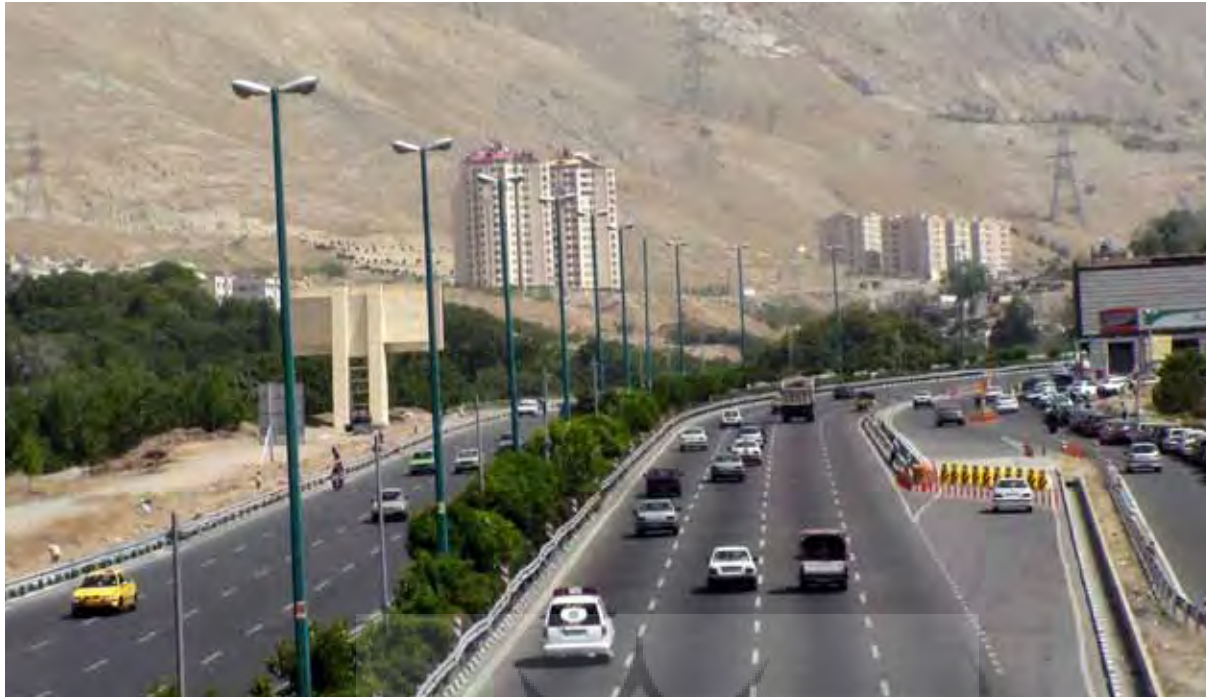
۴ : حاشیه بزرگراه‌های امروز اگرچه با پوسته سبزی تزئین شده اما از نقش اجتماعی و اکولوژیکی تهی است، بزرگراه یادگار امام، عکس : طیبه رحیمی، ۱۳۸۹.