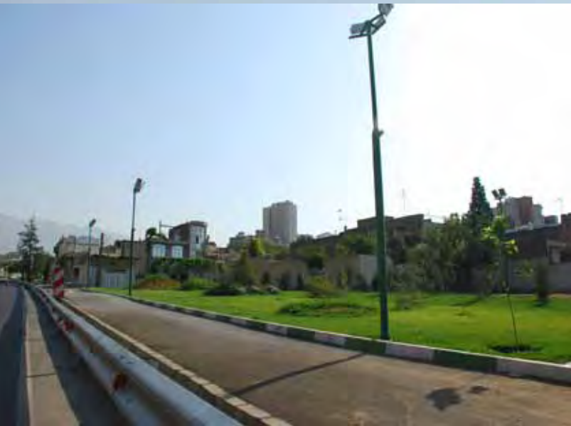
۲: حاشیه بزرگراه‌های امروز اگرچه با پوسته سبزی تزئین شده اما از نقش اجتماعی و اکولوژیکی تهی است، بزرگراه چمران، ۱۳۸۹.

طور ناخودآگاه در جریان رشد تهران، این دو دیدگاه بر هم منطبق شده است. علاوه بر کوهپایه‌های شمالی و جنوبی، تهران دارای تپه‌ماهورهای شرقی و غربی است که جریان هوای شمالی و جنوبی را تا حدی قطع می‌کند و تمرکز بیشتر بر ساخت و ساز در این اراضی بر اهمیت این مسئله افزوده است. ولی عبور بزرگراه مدرس از این تپه‌ها، یک ارتباط اکولوژیکی و تنفسی بین شمال و جنوب تهران برقرار می‌کند. تلاش در جهت ساخت این جداره بعد از انقلاب منجر به تقویت این میکروکلیمای و در نتیجه تقویت اهمیت منظر شهری شده است (تصویر ۱).