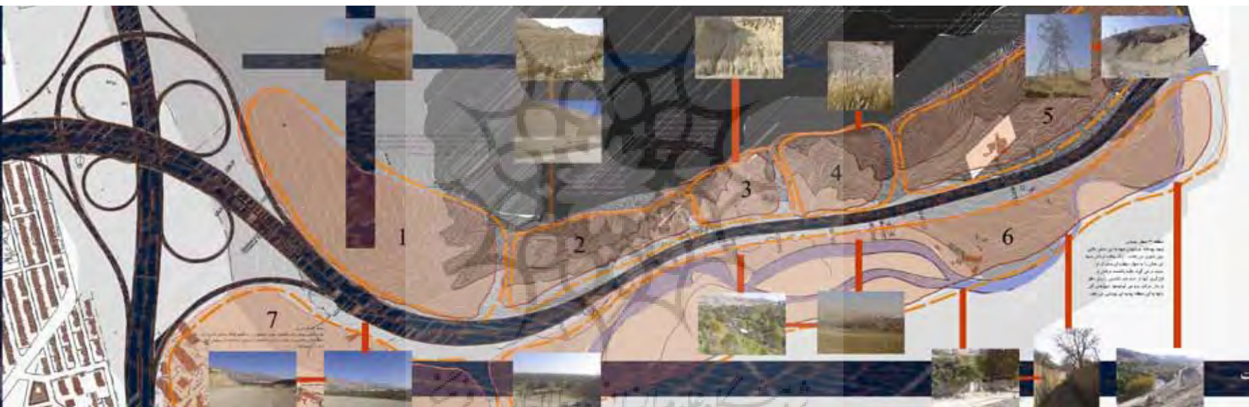
۲: پلان‌ها و تصاویری از مجموعه طراحی شده، مأخذ: پایان‌نامه کارشناسی ارشد نگارنده.

از میان حالت‌های کلی مطرح شده، نقش ورودی به عنوان نقطه انفعال حومه و شهر و نقطه ورود به سازمان فضایی شهر مهم‌تر از بقیه تشخیص داده شد. پذیرفتن این نقش لزوم ایجاد احساس ورود، احساس عبور از فضای واسط و خاطره‌انگیزی و نشانه بودن در فضا را تأکید می‌کند. از آنجا