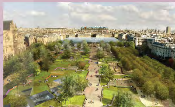
۲: طرح پیشنهادی دیوید مانژن - دفتر طراحی SEURA - طرح منتخب، مأخذ: www.seura.fr