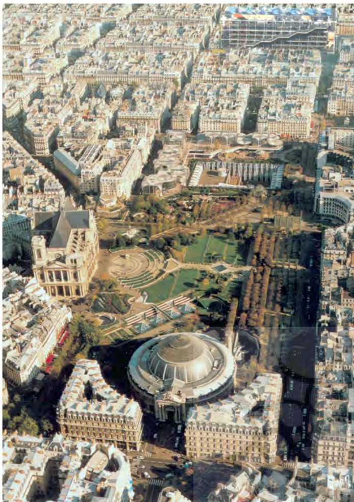
۴: اکنون باید دید که طرح معمار یا اعمال سلیقه شهروندان، کدامیک می‌تواند این عرصه را به دامان شهر باز گرداند؟