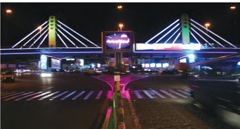
نورپردازی در خدمت حرکت نه زندگی شهری، مأخذ: نگارنده، ۱۳۸۸.