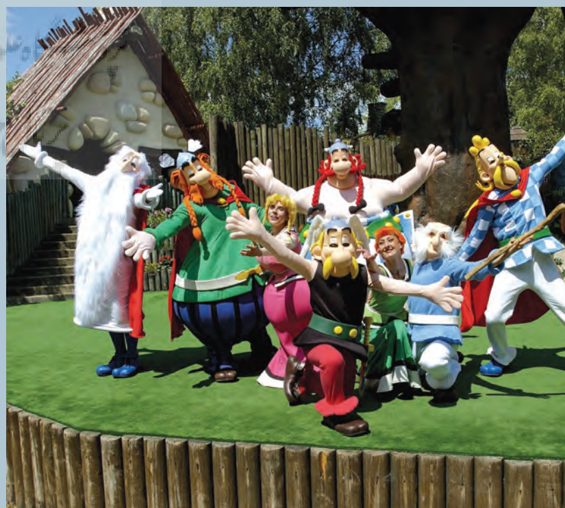
الهام از داستان‌ها و تاریخ مشترک در پارک‌های موضوعی