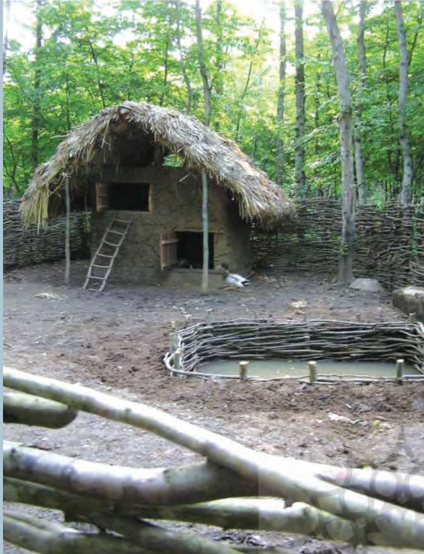
عدم درک صحیح از قلمرو مکان به واسطه نگاه کالبدی صرف، موزه فضای باز روستایی گیلان / مأخذ: نگارنده