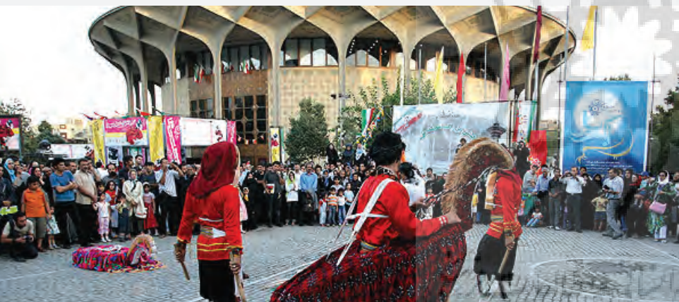
حال و هوای این فضای شهری در ایام برگزاری جشنواره تئاتر فجر

همچنین احساس تعلق به چنین محیطی باعث شده که شهروندان و به ویژه هنرمندان و قشر فرهنگی جامعه، در برابر مکانیابی نادرست ایستگاه مترو در محوطه آن، واکنش نشان دهند و اینجاست که شهروندی و مدنیت به معنای واقعی کلمه محقق می‌شود. در این حالت، صیانت از خاطرات مشترک شهروندان از عرصه باز مقابل تئاتر شهر، نزد آنها به هدفی مشترک برای مقابله با یک تصمیم غیرکارشناسی مدیریت شهری بدل می‌شود. برگزاری اجتماعات هدفدار حول محور تئاتر، فعالیت‌های فرهنگی خودجوش متأثر از محیط و تجمعات موسمی در صحن تئاتر شهر همچون تجمعات ۸ مارس به مناسبت روز جهانی زن، ۱۹ شهریور، روز آزادی نرم‌افزار و ۲۰ دسامبر، روز جهانی مبارزه با ایدز، خود گواهی بر موفقیت این فضا در گرد هم آوردن شهروندان و تحقق مشارکت مدنی آنان است.