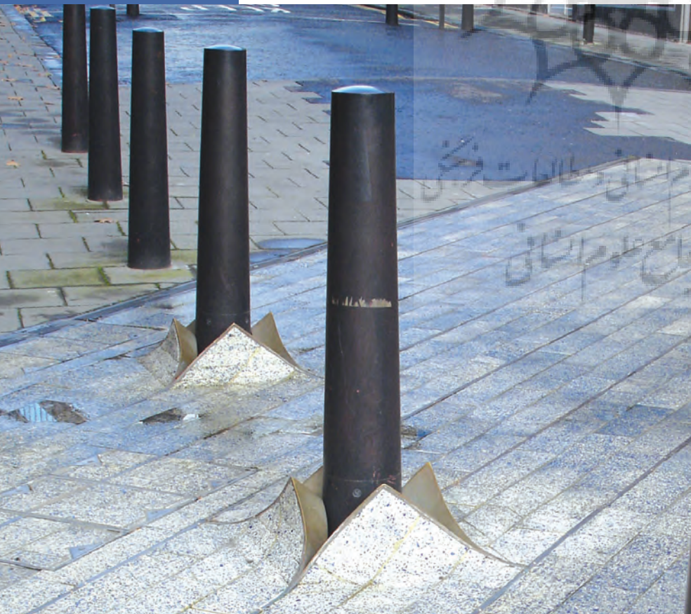
۲: رفتار منعطف کفسازی در برخورد با تیرک‌های مانع ورود خودرو