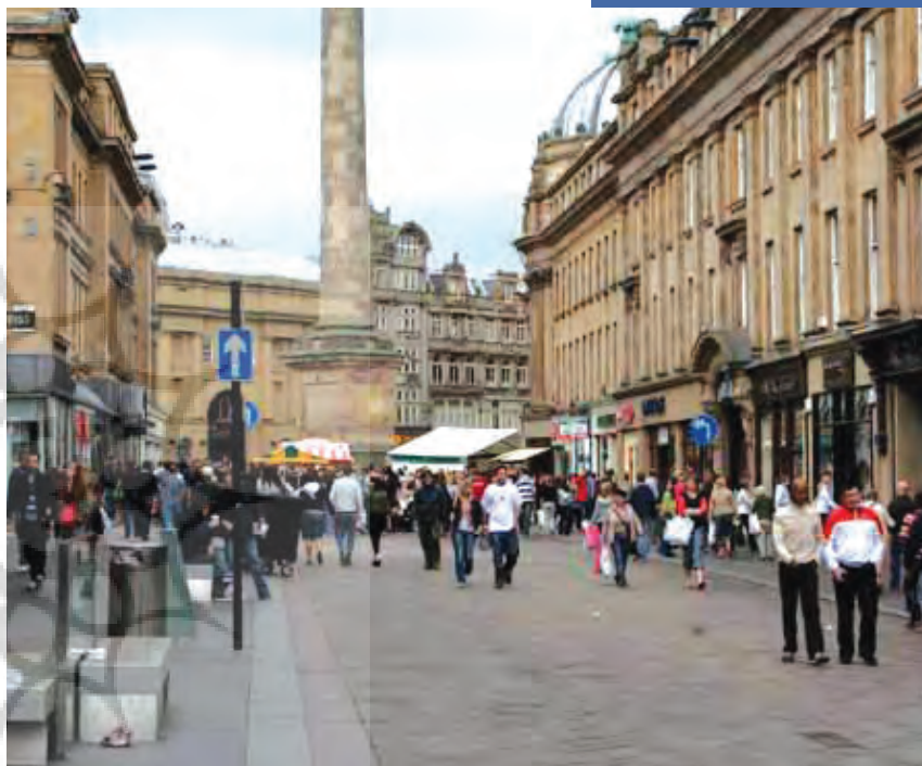
«فرش آبی»، فضای شهری طراحی شده برای مردم

تبرک‌های مانع ورود خودرو، به طرز هنرمندانه‌ای از کف سربرآورده و مصالح کفسازی را خم نموده‌اند (تصویر ۲). نیمکت‌های این فضای جمعی از تاخوردن و برگشتن نوارهایی از کفسازی ایجاد شده است. در فضای خالی کنار نیمکت‌ها، لامپ‌های فلورسنت به منظور نورپردازی فضا، تعبیه شده‌است (تصویر ۳). مصالح کف به‌گونه‌ای انتخاب شده که این مکان، متمایز از سایر مکان‌ها و خیابان‌های همجوار باشد. در این پروژه پله‌ای گرد رابط میدان جدید به پیاده‌روی است که از شاهراه مرکزی عبور کرده و به پارکینگ بزرگ و مترو می‌رسد.