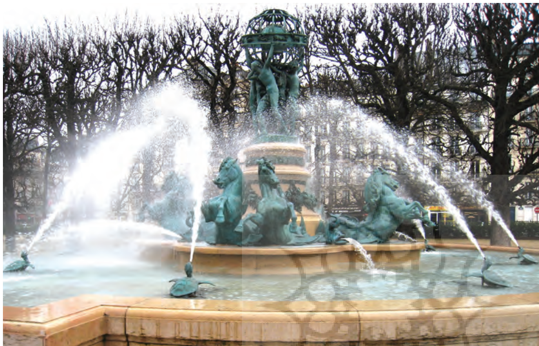
فضاهای عمومی، زیبایی‌های هنر شهری را با مردم به اشتراک می‌گذارد، آبنمای رصدخانه، پاریس

۴ در دوره مدرن تحول بزرگی در رویکرد به آثار هنری پدید آمد. هنر، به جای آنکه به عنوان ابزار در خدمت بیان مفاهیم قدسی یا اسطوره‌ای مصنوع