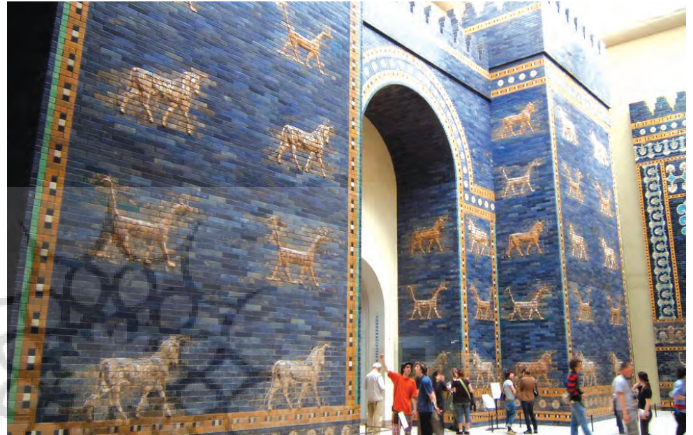
تسلط اساطیری هنر شهری بر معماری معابد، دروازه ایشتر، بابل، مأخذ: www.flickr.com

۱ قدیمی‌ترین نمود هنر در محیط‌های شهری مربوط به عصری است که هنر، به بیان امر مقدس و اسطوره‌ای می‌پرداخت. در دوره تسلط اساطیری هدف انسان راهیابی به اسرار آسمان بود؛ زیرا آسمان منشأ همه تحولات و حوادث زمین به شمار می‌آمد. دخالت آسمان، دخالتی جزءنگر بود که همه اتفاقات را در بر می‌گرفت. باران و باد، خشکسالی، بیماری، جنگ، غارت و هر پدیده دیگر توسط ساکنان آسمان برنامه‌ریزی می‌شد و برای زمینیان به اجرا در می‌آمد. هنر این دوران، بیان فرایند و دست اندرکاران «تقدیر آسمانی» بود. نمونه‌های این هنر را بر دروازه شهرها و پیکره معماری، به صورت مجسمه و نقش‌های برجسته و تزیینی می‌توان دید. هنر شهری در این دوران وابسته به معماری است و در بناهای خاص جلوه‌گر می‌شود. معابد، کاخ‌ها و میدانگاه‌ها مهم‌ترین محل ظهور هنر در محیط زندگی انسان است. هدف آن نیز بیان رسمی اعتقادات ساکنان شهر نسبت به روابط زمین و آسمان است.