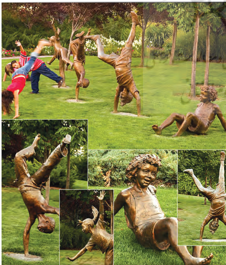
ارتباط کودکان با مجسمه‌ها، به زیبایی و هویت هنر شهری معنایی دوچندان می‌بخشد.

مردم‌دوستی هنر شهری با خروج از موزه و شرکت در زندگی مردم پیدا می‌شود. اما چه می‌توان کرد که کارفرمای شهر دستگاه عمومی حامل قدرت است. این دستگاه البته به هنرمند اجازه نخواهد داد که بر او بتازد. لاجرم هنر شهری هنری عقیم خواهد شد که باید از گل و بلبل بگوید و در حریم آزادی و عدالت وارد نشود. این پارادوکس را جامعه‌مدرن باید حل کند.