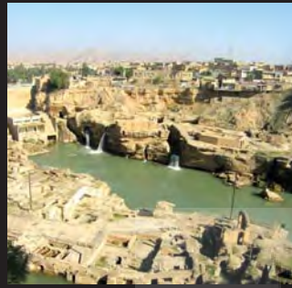
شوشتر، استان خوزستان