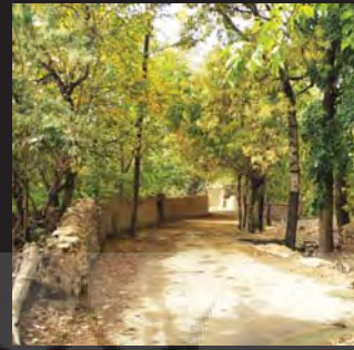
نراق، استان مرکزی