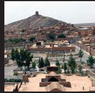
انارک، استان یزد