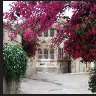
بوشهر، استان بوشهر