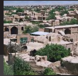
میبد، استان یزد

شهرهای تاریخی و بناهای تاریخی حفظ می‌شوند چون تبلور فرهنگ مبنی بر دانایی است. می‌مانند چون به مانند چشمه‌های جوشان دانایی را از ذات خود به بیرون جاری می‌سازند و بر دل می‌نشینند چون جاذبه‌های فراوانی برای انسان ارزش‌گرا و دانا دارند.