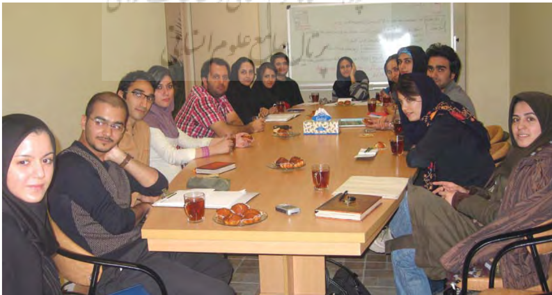
میزگرد انجمن معمار ۲۴ - / پژوهشکده نظر

مثلاً زها حدید هر پروژه و هر کاری که بهش بیدید اون مدلی که خودش بخواد را اونجا می‌گذاره. هر چی که خودش بگه، هر کاربری، توی هر