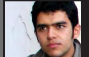
علی آشتیانی / دانشگاه شهید بهشتی