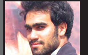
علی آشتیانی / دانشگاه شهید بهشتی