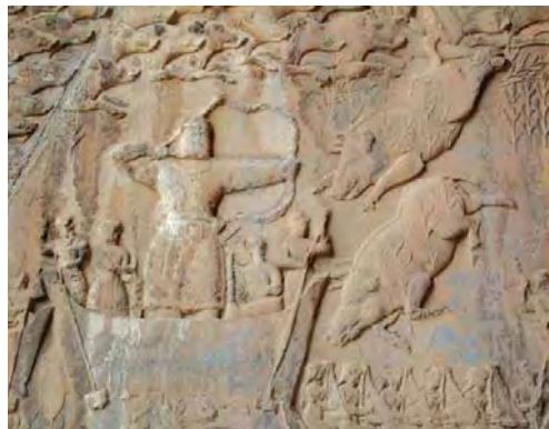
الگوهای ایرانی دیوارنگاری، شکل گرفته در طول زمان